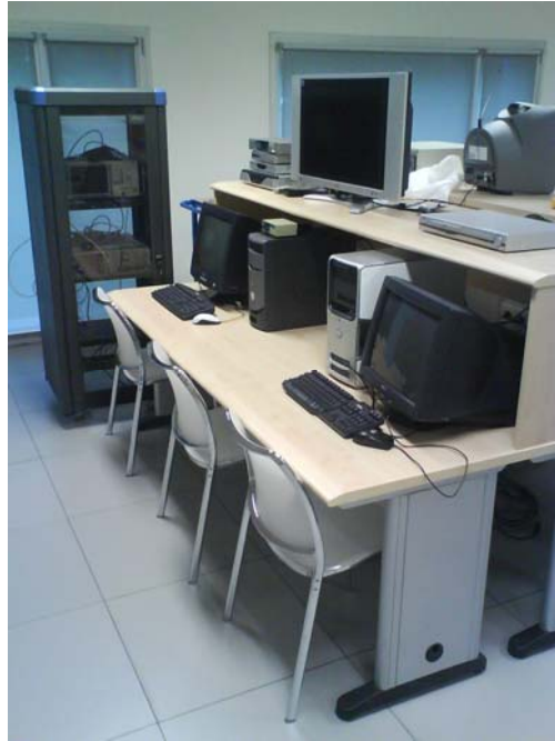
Figura 1. Fotografía del puesto de laboratorio.

La Figura 1 muestra una fotografía del puesto de laboratorio utilizado en esta asignatura.