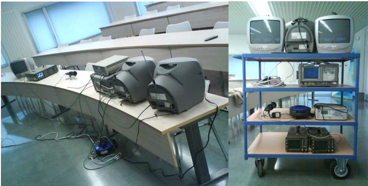
Figura 2. Fotografía del setup para explicar el sistema PAL.