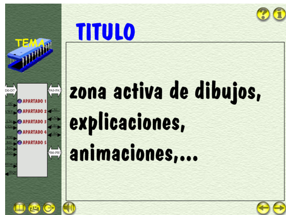
Figura 3: Composición de Pantalla con menú.