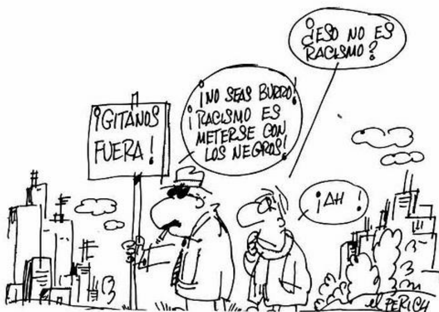
Viñeta de cómic de Forges