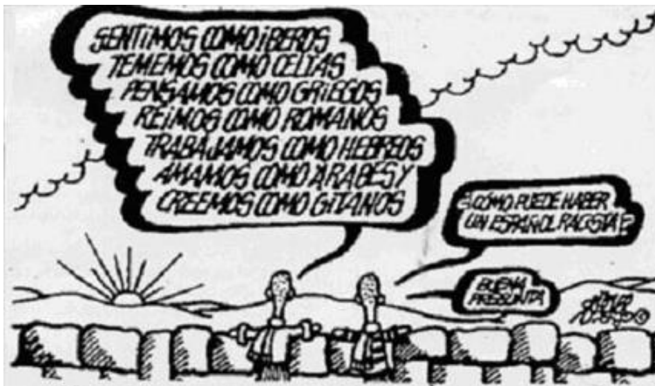
Viñeta de cómic de Forges