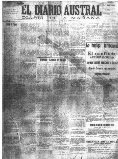
Fotografía 1: portada de 1916

Como resultado de la aplicación de la plantilla de análisis de contenido en las portadas, podemos identificar que éstas están compuestas principalmente por una gran cantidad de textos, los cuales presentan un extenso desarrollo, por lo que la información escrita abarca la mayor parte de la página, presentándose de una forma lineal. Ésta es una condición característica de los textos narrativos, puesto que necesitan de la argumentación de su contenido para otorgarle sentido y validez a la información. A su vez, estos textos deben su forma a las prácticas de la oralidad que supone de la sucesión de los acontecimientos en el tiempo, como señala Gonzalo Abril, proponiendo una estructura y una lectura de tipo lineal.