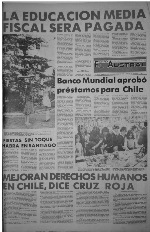
Fotografía 2: portada de 1976

1976 marca un hito fundamental en el desarrollo tecnológico del diario, puesto que se incorpora el sistema de impresión offset ; imprenta de marca Cotrell, fabricada en Estados Unidos, que consta de seis unidades que pueden imprimir un diario tamaño estándar, pudiendo realizar impresiones en blanco y negro, a dos colores y a todo color. Si bien es cierto, la presencia del color y de la fotografía, es posible identificarlas esporádicamente con anterioridad (ver fotografía 2):