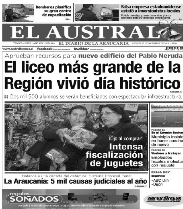
Fotografía 4: portada del 2010

Finalmente, es preciso señalar que todos estos avances tecnológicos que condicionan la nueva forma en que se presentan los textos informativos en El Austral , no hubieran podido ser desarrollados sin la presencia de una matriz cultural informativa que condiciona en gran medida nuestras formas de interpretar, mirar y dar sentido a las portadas de los periódicos.