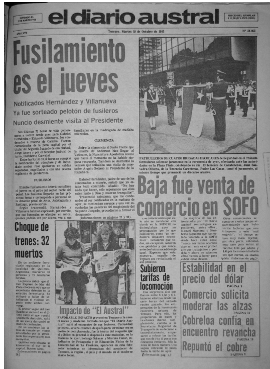
Fotografía 3: portada de 1982

En este sentido, retomamos lo planteado por Abril al acuñar el concepto de espacio sinóptico, el cual supone de una mirada integradora de los diferentes componentes visuales de la página que al ser recepcionados por los lectores, causan un estímulo determinado, en el caso de el diario, la compra del ejemplar, transformándose la lectura en una interpretación acción (ver fotografía 3):