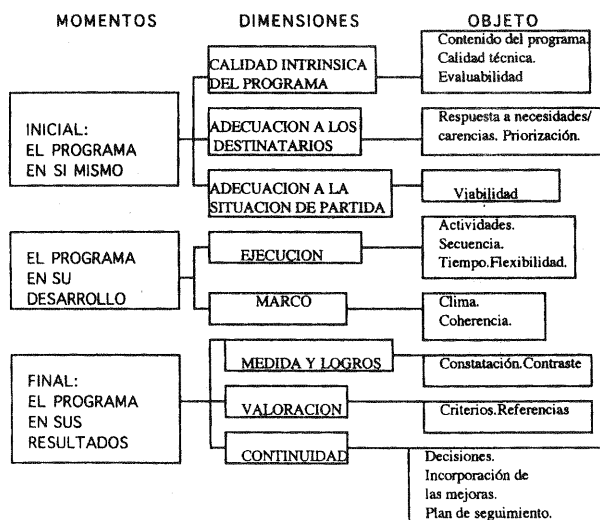
CUADRO N°2: PROPUESTA EVALUATIVA DE PROGRAMAS EDUCATIVOS

El mismo investigador concretiza su propuesta de evaluación en el siguiente esquema: