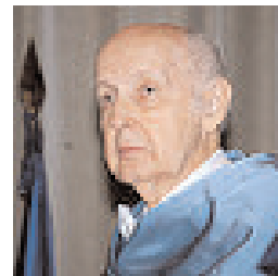
Dr. Santiago Grisolia

La comunidad educativa de la UNED se congratula de incorporar a su Claustro de Doctores a MARGARITA SALAS y a SANTIAGO GRISOLÍA, especialmente en este año 2011 declarado por la Asamblea General de la ONU Año Internacional de la Química , por sus muchos valores profesionales y humanos y por los avances que sus investigaciones han logrado.