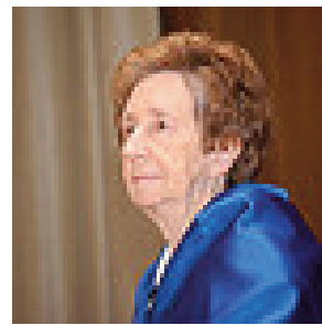
Dr. Margarita Salas.

http://portal.uned.es/portal/page?_pageid=335,3622335&_dad=portal&_schema=PORTAL&idEntrada=3007 &id-Plantilla=1