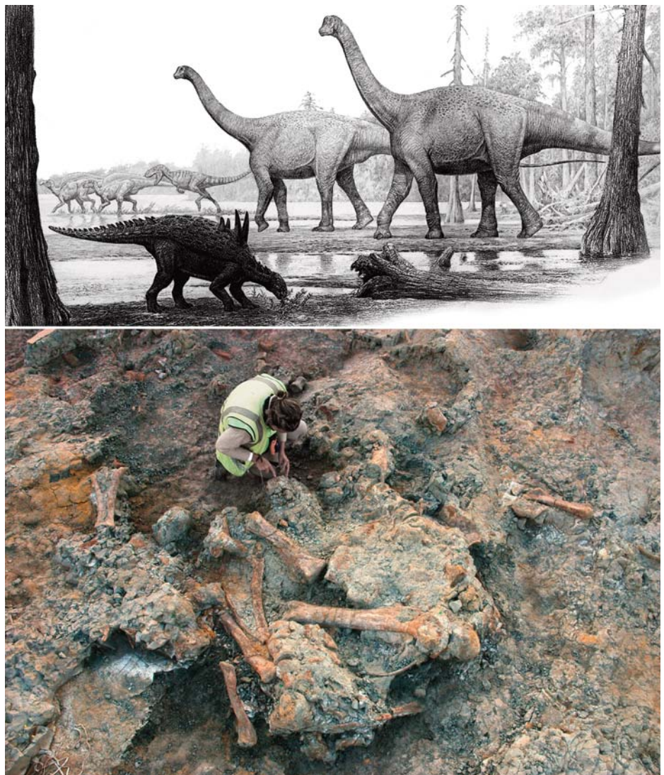
Figura 2. Fósiles de Lo Hueco (Cretácico Superior, Cuenca). Arriba: recreación de un paisaje con fauna típica del Cretácico Superior ibérico. Abajo: Proceso de extracción de los restos de un dinosaurio titanosaurio en el yacimiento de Lo Hueco.

En las calizas laminadas de Las Hoyas se recogieron los restos del dinosaurio ornitomimosaurio Pelecanimimus polyodon . Pelecanimimus fue el primer Ornithomimosauria hallado en Europa y uno de los más antiguos