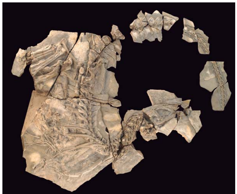
Figura 1. Fósiles de Las Hoyas (Cretácico Inferior, Cuenca). Ejemplar tipo del dinosaurio carcarodontosaurio Concavenator corcovatus , prácticamente completo y articulado (para más información ver referencia [4]).

A pesar de que la localidad de Las Hoyas se conoce tan sólo desde mediados de los años 80, en la actualidad constituye un referente básico para comprender la estructura de los ecosistemas continentales de Cretácico Inferior. El yacimiento localizado en el término municipal de La Cierva, en la zona meridional de la Serranía de Cuenca, está constituido por las calizas litográficas resultantes de la sedimentación en un humedal durante parte del Cretácico Inferior. Las Hoyas pertenece a un tipo de yacimiento que conocemos como “depósitos de conservación excepcional” y, como tal, muchos de los fósiles representan con exquisita precisión las estructuras de los organismos que los originaron (Figura 1). Esto se debe fundamentalmente a las condiciones de fosilización