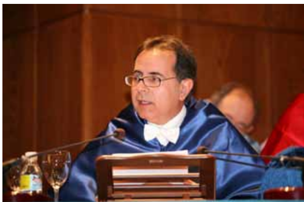
El profesor Avelino Corma impartiendo la conferencia de investidura.

También dio gran importancia al diseño y la síntesis de nuevas estructuras cristalinas y nanoporosas que han permitido