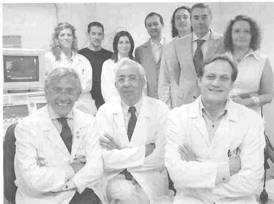
Foto del grupo completo de investigación. A la derecha y de pie se encuentran nuestros compañeros de la UNED.

se iba llenando de sangre pasivamente, y el trabajo ha demostrado que, además de bombear sangre, se revela como una auténtica bomba de succión que, cuando falla, altera el llenado.