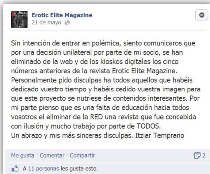
Imagen 9. Las redes sociales sirvieron para dar una explicación sobre el prematuro cierre del portal

Y en las redes sociales, la explicación de su fundadora: