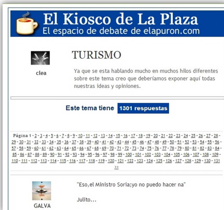
Imagen 10. Espacio de debate que exige una exhaustiva labor de moderación por parte del profesional en uno de los blogs analizados

Aunque se pongan en marcha los mecanismos oportunos para coordinar la actividad desplegada en blogs de este tipo, lo que se produce es un enorme desgaste físico y psíquico según confiesan algunos comunicadores: