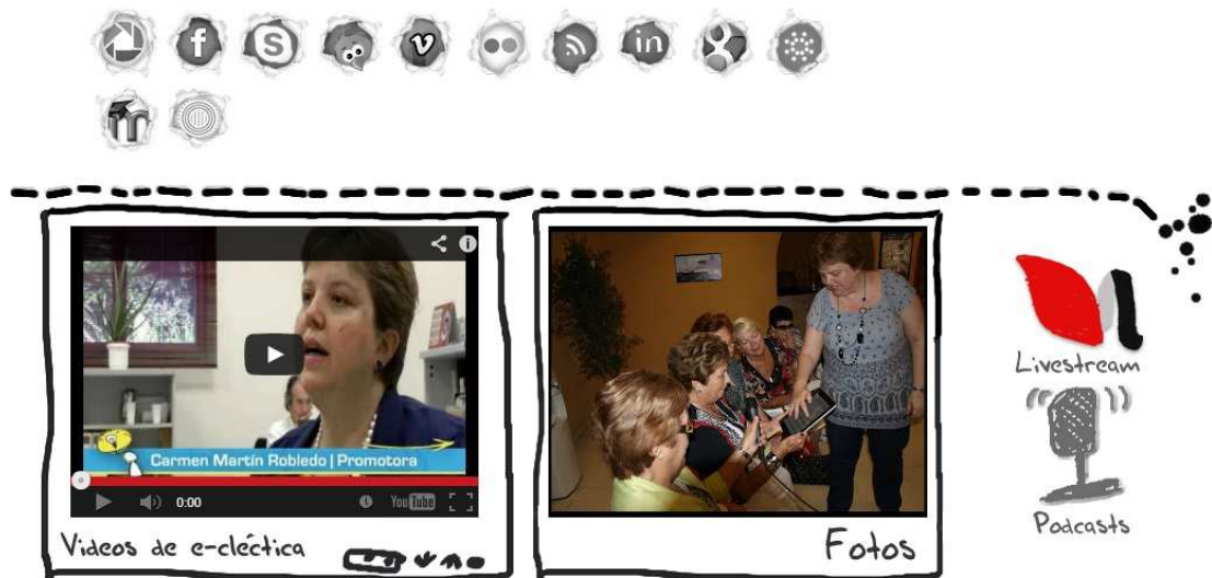
Imagen 7. La web social permite, con la utilización de distintas herramientas, enriquecer el proceso comunicativo.

Y es García de Madariaga (2008: 120) quien glosa la figura del nuevo comunicador cuando hace referencia a que “las corrientes de concentración y descentralización se materializan en la figura del periodista-orquesta de los medios convencionales por un lado, y la del nuevo emisor independiente, experto y no profesional que opera a través de la Red para presentar su versión de la realidad por el otro”.