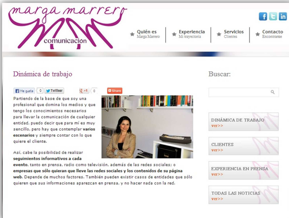
Imagen 4. El comunicador aprovecha sus portales no solo para presentarse sino para dar a conocer su carta de servicios y mostrar públicamente sus habilidades

Se constata así que los protagonistas de este estudio se convierten en profesionales versátiles y multitarea con diferentes grados de habilidad y conocimiento: