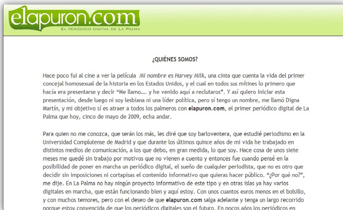
Imagen 6. Declaración de intenciones de la fundadora de El Apurón en la inauguración de la web en 2009.

Yo estaba trabajando en El Día, me echaron del periódico y decidí que, en lugar de esperar a que me surgiera algo, empezar un proyecto porque no quería estar parada. No sabía si iba a encontrar trabajo porque ya estaban las cosas muy mal y decidí lanzarme y empezar un proyecto porque no necesitaba mucha inversión para hacerlo y vi que había un hueco en La Palma que no estaba cubierto y que podía ser interesante porque había alguna web por ahí, pero ningún periódico digital. No había nada serio y me lancé por eso, pero no fui producto de la crisis ni el periódico tampoco [2].