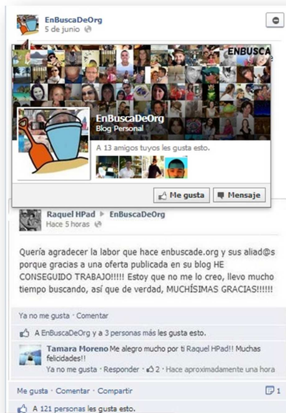
Imagen 11. Modelo de interactividad personalizada en las redes sociales

que se parece al 15M 21 . Digo esto porque a pesar de que seguimos realizando una labor de búsqueda, el 80% del contenido que publicamos nos lo envía nuestra comunidad: gente que va por la calle y saca una foto de una oferta con su Smartphone y nos la envía, gente que se lee los boletines por la mañana y nos envía las becas que salen, gente que se lee InfoJobs 22 , ve las ofertas y nos las remite... Yo siempre digo que la mayor riqueza que tenemos es la comunidad [10].