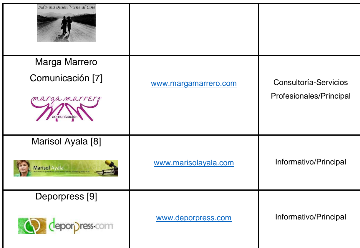
Imagen 1. Tabla de blogs analizados y sus direcciones web

Las conversaciones fueron grabadas íntegramente para propiciar una atención completa hacia la figura del interlocutor (gestos, miradas, silencios...) mientras que las cuestiones planteadas y posteriormente desarrolladas, se relacionaron directamente con la percepción que los entrevistados tienen acerca de la transformación que se está dando, como nueva tendencia laboral, en el sector de la comunicación del Archipiélago. En este sentido, se requirió la opinión acerca de cuestiones, actividades y movimientos emergentes en el mundo de la Web social.