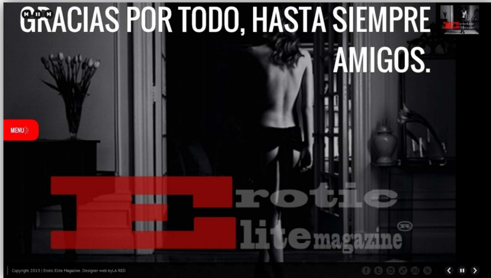
Imagen 8. Cierre de un portal.

Y en las redes sociales, la explicación de su fundadora: