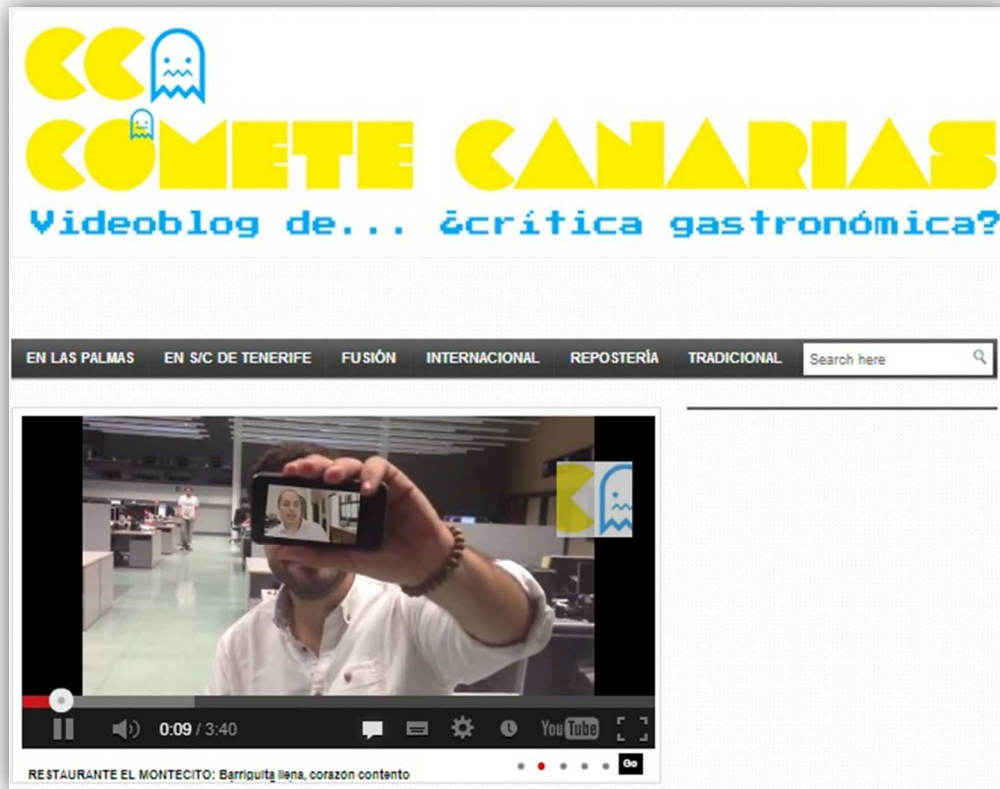
Imagen 5. El comunicador usa las herramientas para simplificar y abaratar los procesos productivos

son. Soy barato, puedo competir por todo lo que hemos hablado y por eso estoy en el mercado... porque soy barato, no porque soy bueno, básicamente [5].