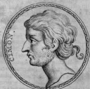
Apud Fulvium Ursinum in numismate aere

Ubi Servius acerbum. Propter pydi- tum patrem. Consule Parei notas ad Quintilian. lib. vi. Instit. Orator. Prooem. pag. 493. Vult itaque Ne- pos indicare, Cimonis mortem ci- vibus vitam fuisse maturam , i. e. praematuram, praecipitem, festina- tam, ac quasi ante diem venientem, ideoque acerbam, quia, dum vixit, omnibus profuit. Nam talis mors etiam matura vocatur. vide Elegan- tiss. Broukhuis. ad Tibull. l. 4. El. 1. vs. 205. Egregius Livii locus Libro 7. cap. 1. Maximeque eam pestilentiam insignem mors quam ma- tura, tam acerba M. Furii fecit. Pro secura Voss. A. secuta.