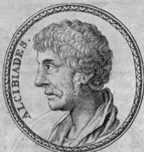
Apud Fulvium Ursinum in Gemma.

7. ext. 9. 3, 1. ext. 1. 6, 9. ext. 4. Frontinus 2, 5, 44. & 45. 2, 7, 6. 3, 2, 6. 3, 6, 6. 3, 9, 6. 3, 11, 3. 3, 12, 1. Cicero aliquoties. &c. Boeclerus. Ejus vitam & res gestas politica commentatione illustravit Italico sermone Virgilius Malvezzas. Bosius.