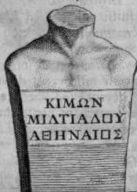
Apud Fulvium Ursinum in siphis ex marmore.