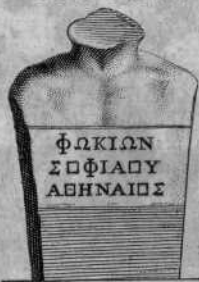
Apud Fulvium Ursinum in schedis ex marmore.

scribitur: sed melius aliis Phocion , ut Cimon, Conon, Timoleon . Phoci fi- lium, & φώκω, vocant Aelianus Var. 2, 26. & Suidas . Cochlearii filium, idem Aelianus 12, 43. Bosius .