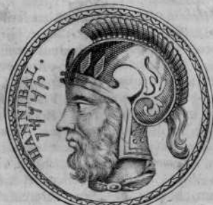
Apud Fulvium Ursinum in numismate Argenteo

siastae Lipfienfis , amici dum vive- ret conjunctissimi; sed in altera parte erat caput Aristotelis cum his circum litteris: ΑΡΙΣΤΟΤΕΑΟΤΣ ΤΟΤ ΝΙΚΟΜΑΧΟΤ: plane quale est in argenteo meo, cujus adver- sa facies exhibet Naturam multi- mammiam , utraque manu fructus gerentem, cum inscriptione: ΦΡ- ΞΙΣ ΠΑΝΑΙΟΑΟΣ. Habebat idem Meierus & argenteum, in quo cap- ut Hannibalis cum hac inscriptio- ne: — ILLE HANNIBAL, de- trita priorie illius parte. Ejusdem caput e nummo argenteo tetra- drachmo exhibent Imagines Ursini num. 63. una cum litteris Punicis , nomen ejus, (ut aiebat, cujus is nummus fuit: Petrus Contarenius ) exponentibus. Duas quoque gem- mas, in quibus Annibalis pueri effi- gies exstat, laudat Faber in commen- tario : vide infra ad cap. 2, 4. Bo- fius .