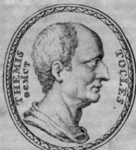
Apud Fulvium Ursinum in Gemma.