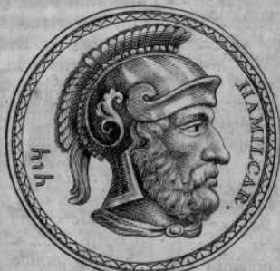
Apud Fulvium Urſinum in numismate Argenteo

vium & Florum , quos idem laudat, ulla noſtri mentio. Sicuti nec apud Valer. Max. 4, 3. apud quem & qui 1. 7. ext. 8. memoratur Hamilcar, non hic, ſed Giſconis F. eſt. Ejus caput, ut volunt, exhibetur in numo argenteo tetratrachmo inter Imagines illuſtrium Fulv. Urſini, num. 9. ad quam vide commentar. Jo. Fabri, pag. 9, 10. integra vero effigies in duabus gemmis ejusdem, de quibus dicemus ad 23, 2, 3. Neminem ex feliciffimis etiam regibus ei comparandum eſſe, cenſebat Cato apud Plutarchum in vita, pag. 340. Martem alterum a ſuis vocatum, apparet e Livio 21, 10. Alia illius eclogia habes apud Diodorum in exc. Peireſc. lib. 23, 24. Zonaram l. c. pag. 55. alioſque. Boſius.