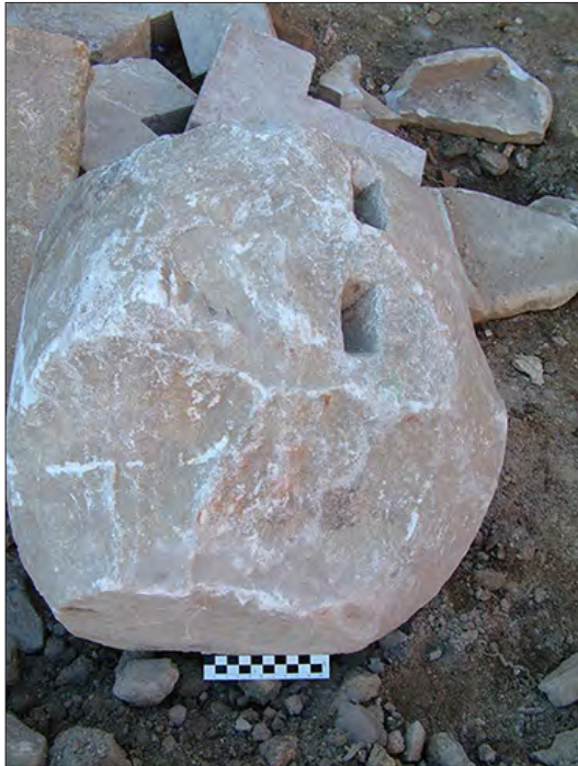
FIGURA 7. FRAGMENTO DE FUSTE EN MARMOR LUNENSE PREPARADO PARA SER RECORTADO PROCEDENTE DEL DEPÓSITO LOCALIZADO EN LA ZONA DEL ANTIGUO COLEGIO JAUME I (TARRAGONA).

2) La presencia de grandes depósitos marmóreos de época tardorromana que recogían piezas procedentes del desmantelamiento de antiguos edificios. Podemos citar, a modo de ejemplo, el gran depósito localizado en 2002 en la parte alta de la ciudad de Tarragona, a escasos metros de las estructuras del Foro Provincial, formado por más de 4500 fragmentos de mármol, la mayoría placas de revestimiento (Arola et alii 2012: 190-195): entre las piezas localizadas destaca un fragmento de fuste preparado para ser recortado (figura 7) (Arola et alii 2012: 194 y fig. 6). También de Tarragona procede un fragmento de fuste en Carrara cuya superficie aparece repicada, eliminando así los listeles y acanaladuras, y en cuyo interior comenzó a labrarse un elemento decorativo que puede fecharse en época visigoda, concretamente en el siglo VI d.C. en base a sus características estilísticas (Domingo 2015b: 533, fig. 6).