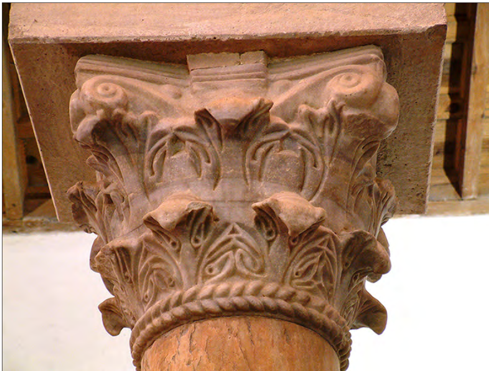
FIGURA 4. CAPITEL CONSTANTINOPOLITANO REUTILIZADO EN LA IGLESIA DE SAN CEBRIÁN DE MAZOTE (VALLADOLID), PARCIALMENTE REELABORADO POR ARTESANOS MOZÁRABES.

La Arqueología sugiere que en Hispania también existió una cierta organización en la recuperación y distribución de los spolia . Ésta explicaría, por ejemplo, que los primeros edificios en reaprovechar elementos arquitectónicos procedentes de importantes conjuntos públicos romanos fuesen construcciones relacionadas con las más altas aristocracias del momento y situadas muy cerca de las grandes ciudades de época romana, convertidas ahora en canteras de extracción de todo tipo de materiales. Por ejemplo, en Córdoba, una serie de asientos en piedra caliza procedentes del Forum Novum o del temenos del templo de la c/ Morería, algunas basas y capiteles en mármol lunense del mismo edificio (Torreras y Ventura 2011: 70-77), las columnas de la porticus in summa cavea del teatro romano (Monterroso 2002: 150-151) y otros elementos procedentes del recinto del templo de la c/ Claudio Marcelo (Peña 2010: 154), aparecen reutilizados a finales del siglo III d.C. en el complejo de Cercadilla, levantado a tan sólo 600 m de las murallas de la ciudad. 16