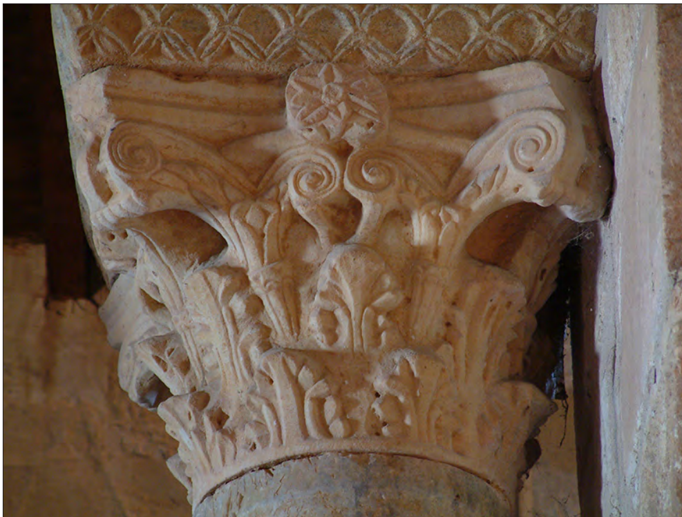
FIGURA 8. CAPITEL DEL SIGLO III-IV D.C. REUTILIZADO EN LA IGLESIA DE SAN JUAN DE BAÑOS (PALENCIA).

de Escalada (León), erigida el 905 d.C. y ampliada el 913 d.C., dos capiteles del siglo IV d.C. fueron reaprovechados en las columnas más avanzadas de las naves (figura 9) (Domingo 2010b: 280; Domingo 2011: n° 752-753). Por el contrario, la disposición de los fustes, también reaprovechados, no parece regirse por ningún orden determinado. 31 Finalmente, un caso particular se documenta en la iglesia de San Cebrián de Mazote (Valladolid), erigida seguramente en el 916 d.C. En su interior se conservan 38 capiteles, 14 de los cuales visigodos reaprovechados y 4 ejemplares constantinopolitanos, que se distribuyen por el interior del templo de forma aparejada (Domingo 2011: 100): cuatro capiteles idénticos del siglo VII d.C. a los pies de la iglesia, dos capiteles iguales de los siglos VIII-X d.C. a continuación, cuatro ejemplares constantinopolitanos de entre finales del IV d.C. y la primera mitad del V d.C. en las columnas centrales de las naves, dos ejemplares iguales del VIII-X d.C. en las últimas columnas de las naves y dos ejemplares del VII d.C., idénticos a los cuatro ejemplares emplazados a los pies de la iglesia, adosadas al lado occidental de las pilastras que sustentan el cimborrio (Domingo 2013: 549-579). 32