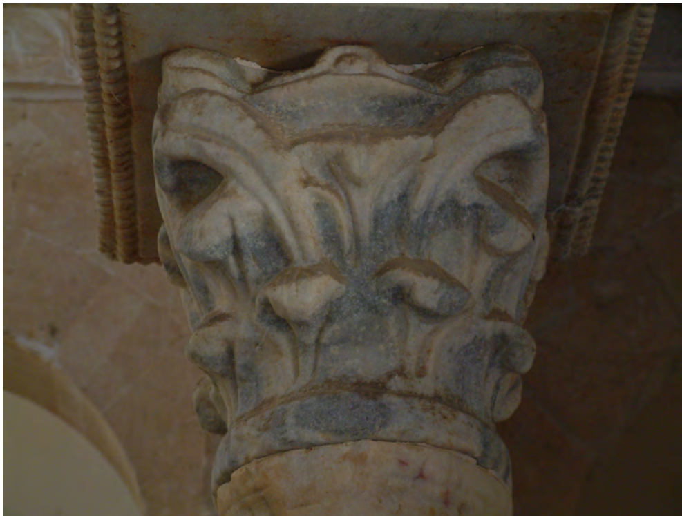
FIGURA 9. CAPITEL DEL SIGLO IV D.C. REUTILIZADO EN LA IGLESIA DE SAN MIGUEL DE ESCALADA (VALLADOLID).

Parece existir, por tanto, una relativa ordenación de las piezas en el interior de los edificios. De todos modos, como hemos señalado precedentemente, la correcta comprensión de este fenómeno pasaría por conocer mejor los mecanismos de gestión y control de la práctica del reaprovechamiento, una información que generalmente no disponemos. Por ejemplo, y por lo que respecta a las iglesias analizadas, la mayoría situadas en el norte peninsular, sería de gran interés conocer la procedencia de los mármoles allí reutilizados, así como las vías de acceso y control de estos materiales. Se ha sugerido que algunas piezas podrían proceder de las grandes villas que en los siglos III-IV d.C. se construyeron o monumentalizaron en la mitad norte peninsular, muchas de ellas pertenecientes a las grandes familias aristocráticas hispanas del momento (Domingo 2013: 558). 33 De todos modos, resulta difícil imaginar que algunas de estas villas estuviesen todavía en pie cuando se levantaron la mayoría de las iglesias que hemos analizado, por lo que las piezas podrían haber sido ya reutilizadas en otros edificios previamente. Por otro lado, quizás el mayor desarrollo de la práctica del reaprovechamiento en la Península en los siglos V-VI d.C. fue consecuencia de una cierta liberalización del mercado o de una disminución del control de esta actividad.