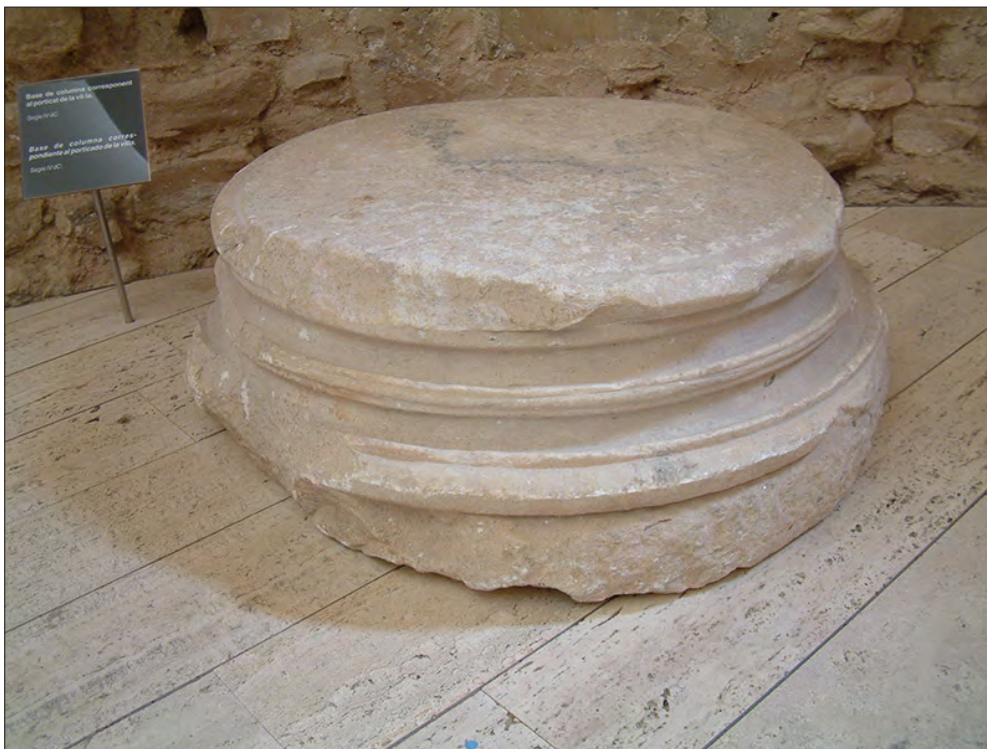
FIGURA 5 BASE COMPUESTA REAPROVECHADA EN EL CONJUNTO ARQUITECTÓNICO DE CENTCELLES (TARRAGONA).

En las inmediaciones de Tarragona, una basa compuesta en mármol de Luni , procedente probablemente del Foro Provincial (figura 5) (Domingo 2010a: 811), un fragmento de mármol decorado con una greca 17 idéntica a la que aparece en algunas cornisas del Foro Provincial, 18 y algunos elementos arquitectónicos de grandes dimensiones en mármol proconnesio , 19 fueron reutilizados en el conjunto de Centcelles, una villa, residencia episcopal, mausoleo 20 o parte de un campamento militar, 21 erigido entre finales del siglo IV d.C. e inicios del V d.C. (Remolà 2002: 106; Remolà y Pérez 2013: 168) a unos 4 km de Tarragona. Fragmentos de capiteles en mármol lunense que por su cronología, estilo y dimensiones pueden equipararse a ejemplares del Foro Provincial de Tarragona (Domingo 2010a: 810-811), aparecen en la suntuosa villa de Els Munts, a 14 km al norte de la ciudad, completamente remodelada entre finales del siglo