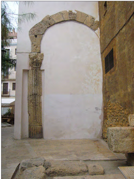
FIGURA 6. UNA DE LAS COLUMNAS DEL CONJUNTO ARQUITECTÓNICO DE LA PLAZA ROVELLAT (TARRAGONA).

IV d.C. e inicios del V d.C., 22 coincidiendo con el inicio del desmantelamiento de algunos sectores del conjunto provincial (Aquilué 1983; Hauschild 1983; Dupré 1989: 125; Rovira 1993: 219; Macias 1999: 196 ss; Remolà 2000: 35-43).