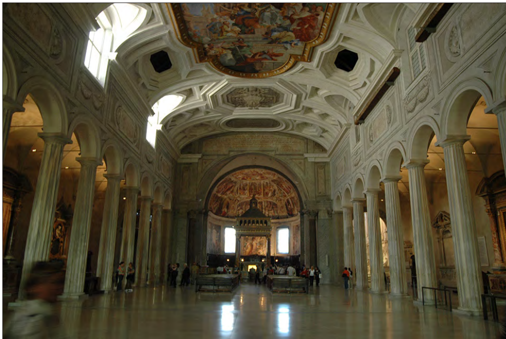
FIGURA. 1. COLUMNAS DE LA IGLESIA DE SAN PIETRO IN VINCOLI (ROMA), PROCEDENTES DE LA PORTICUS LIVIAE . (Foto: J. Á. Domingo).