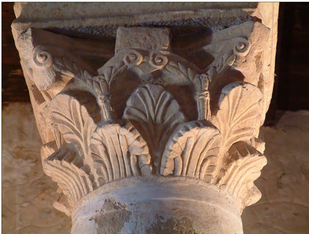
FIGURA 10. CAPITEL DEL SIGLO VII D.C. DE LA IGLESIA DE SAN JUAN DE BAÑOS (PALENCIA) QUE IMITA UN EJEMPLAR DEL S. IV D.C. REAPROVECHADO EN EL INTERIOR DEL MISMO EDIFICIO.