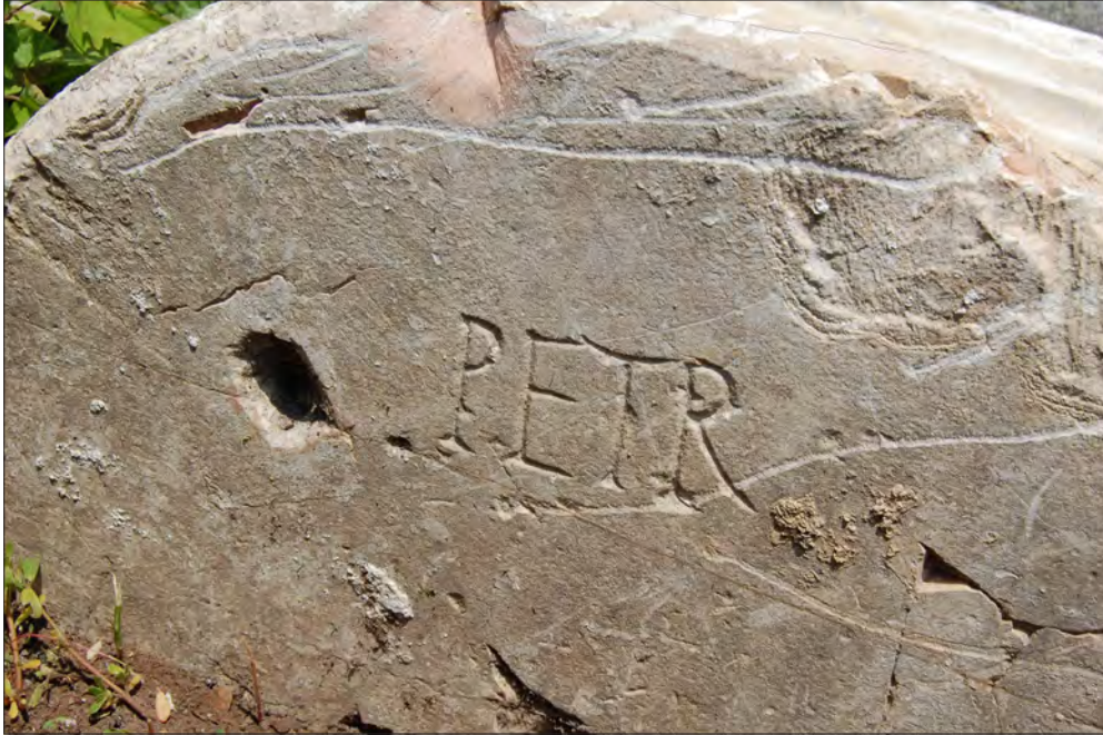
FIGURA 2. INSCRIPCIÓN PETR EN UN FUSTE DEL FORO DE CÉSAR (ROMA).