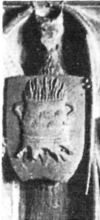
Detall del símbol de l'Orde de la Gerra ressaltada del griu (esq. del sarcòfag) (fotogr. Anna I. Peirats).

la Gerra, ambdues directament relacionades amb Jaume Roig, bé per via familiar, bé per privilegis reials. D'aquesta manera, i com a conseqüència del coneixement cultural documentat de les dues ordes adreçades als més necessitats, els sacerdots malalts o les vídues orfes i la defensa de la religió, els dos blocs textuais que constitueixen la dilatatio d'una introducció temàtica anterior, en què el subjecte líric anuncia una vida dedicada a l'exaltació mariana, han de separar-se mitjançant un punt gràfic en la transcripció del text, per tal com al·ludeixen a dues realitats històriques de la ciutat de València, amb ordenacions, obligacions i beneficis particulars 10 .