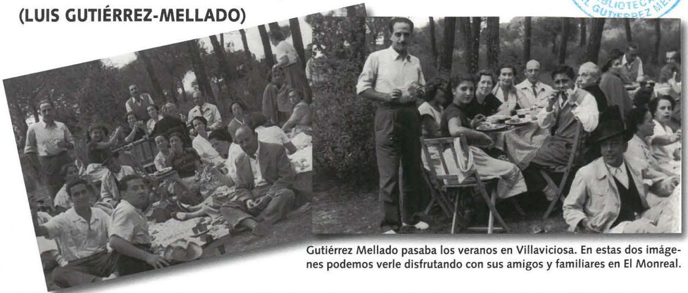
Gutiérrez Mellado pasaba los veranos en Villaviciosa. En estas dos imágenes podemos verle disfrutando con sus amigos y familiares en El Monreal.

Villaviciosa de Odón está de conmemoración. Este año se cumple el centenario del nacimiento del Capitán General D. Manuel Gutiérrez Mellado (Madrid 1912-1995), personaje fundamental en la vida política y militar de la España de la segunda mitad del S. XX e íntimamente vinculado con este pueblo.