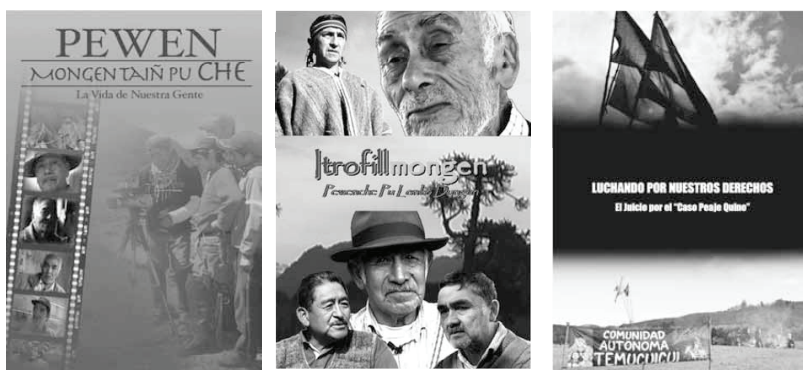
Imágenes 6, 7 y 8: Películas mapuche producidas por ADKIMVN: Pewen Mongen Taiñ Pu Che (2010), Itrofillmongen (2007) y Luchando por nuestros derechos (2012)

y un canal en Youtube, pero destaca sobre todo su producción audiovisual, que realiza en coproducción con lof (comunidades mapuche ancestrales) con el fin de rescatar y proteger la cultura mapuche. Algunos de sus títulos destacados son: Pewen Mongen Taiñ Pu Che (2010), Itrofillmongen (2007) y Luchando por nuestros derechos (2012).