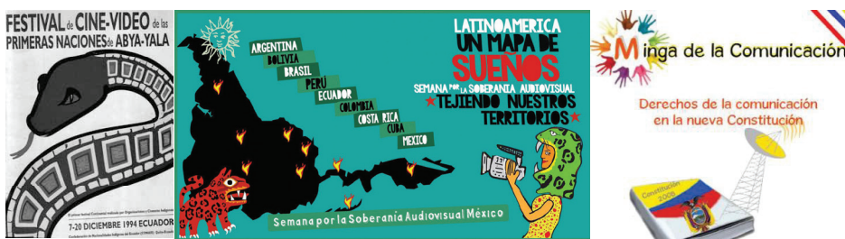
Imágenes 3, 4 y 5: Carteles de los eventos: Primer Festival de la Serpiente (Ecuador,1994), Semana de la Soberanía Audiovisual (México, 2015) y Minga de la Comunicación (Ecuador, 2008).

Del elenco de conceptos que están usando actualmente los comunicadores indígenas sobre su agenda de comunicación, quiero llamar la atención sobre el concepto de soberanía audiovisual , el cual aparece en las declaraciones de las cumbres y es definido como: la producción de obras por los pueblos indígenas que se encuentran en la búsqueda de una imagen propia y plantean distintas miradas que no encuentran un espacio en la distribución comercial (Semana por la Soberanía audiovisual 2015) 7 . Otro concepto sugerente que está emergiendo en los discursos de los comunicadores indígenas es el de la minga de comunicación , encuentros en los que se debate o se da formación sobre comunicación, haciendo alusión a la minga (de la voz quechua mink'a ), la práctica de trabajo colectivo y voluntario que existe en mucha culturas indígenas del Abya Yala.