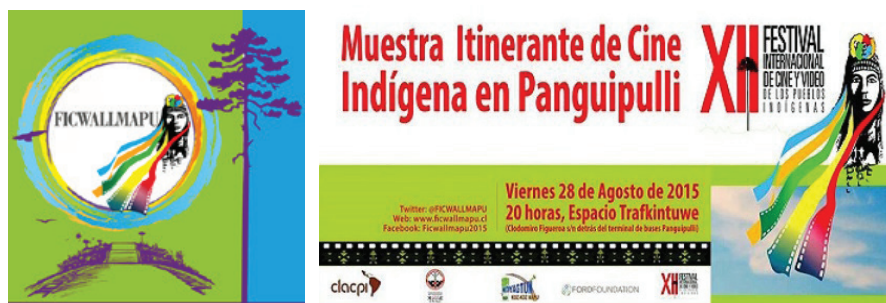
Imágenes 9 y 10: Carteles del Festival FIC Wallmapu 2015 y de una de las muestras de cine itinerante en el territorio mapuche (Chile)

Además del trabajo del festival, cuyo fin es constituirse como un espacio para fomentar el diálogo intercultural, que constituye un proceso social y cultural que sin duda es muy relevante para el territorio y también un aporte a las relaciones interculturales a nivel mundial, convocando a realizadores de Chile, América y el mundo, en torno al desarrollo y producción del cine y las artes con temática indígena (organización del FIC WALLMAPU), el audiovisual de corte indígena se está expandiendo gracias a las Muestras Itinerantes de Cine Indígena por todo el territorio.