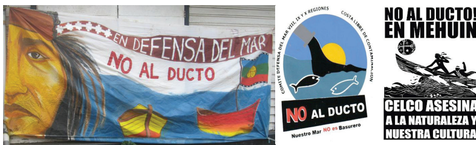
Imágenes 11, 12 y 13 : Carteles del movimiento social de las comunidades mapuche lafkenche del Mar de Mehuín NO AL DUCTO

El kimun mapuche también está vertebrando otras producciones audiovisuales mapuche; de hecho, se está produciendo también una transformación de la iconografía mapuche más allá del lenguaje audiovisual. Muchos movimientos sociales, así como el arte urbano, combinan elementos gráficos de la modernidad occidental con símbolos de la cosmovisión mapuche. Este es el caso de la plataforma ciudadana NOALDUCTO , la cual lucha desde hace 20 años contra la construcción por parte de la forestal Celulosa Arauco (CELCO) de un conducto de vertidos tóxicos en la costa del Mar de Mehuín (Océano Pacífico). Este es el caso de los productos audiovisuales de los movimientos sociales mapuche, los cuales, en línea con la estética audiovisual, combinan elementos ancestrales (hombres mapuche tocados por trarilonkos , bandera wenufoye , el tambor ritual mapuche) y elementos del discurso global, como el discurso ecologista marcado por elementos como el pez contaminado o el tubo de vertidos: