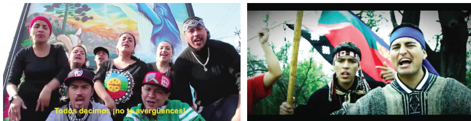
Imágen 16 y 17: Videoclip de la canción Mapudungunfinge (de Wechekeche Ni Trawun ) y Rap de la Tierra ( Luanko )

cuestión de los presos mapuche o los problemas asociados al extractivismo en territorio mapuche, lo que él define como un hip-hop con mensaje mapuche .