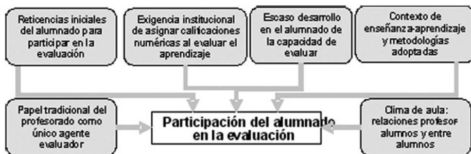
Figura 2: Factores condicionantes de la participación del alumnado en la evaluación

En este apartado revisaremos algunos de los factores que influyen sobre las posibilidades de utilizar modalidades de evaluación participativa en la educación superior. Los principales factores considerados quedan recogidos en la figura 2.