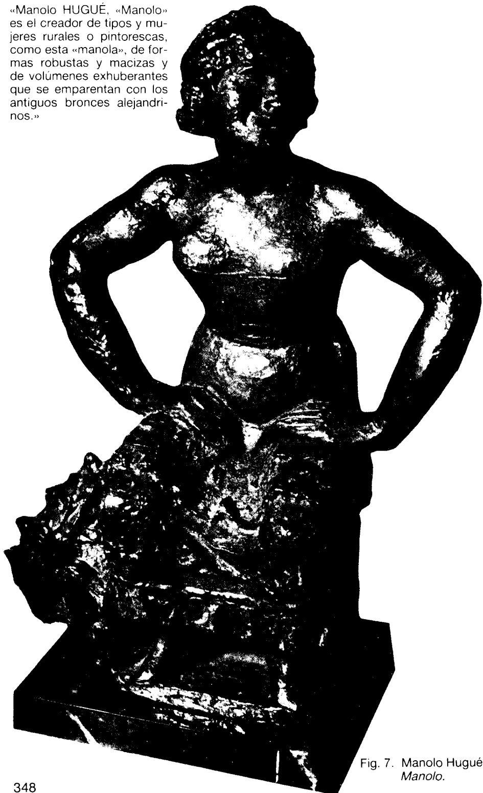
Fig. 7. Manolo Hugué. Manolo.

«Manolo HUGUÉ, «Manolo» es el creador de tipos y mujeres rurales o pintorescas, como esta «manola», de formas robustas y macizas y de volúmenes exuberantes que se emparentan con los antiguos bronce alejandrinos.»