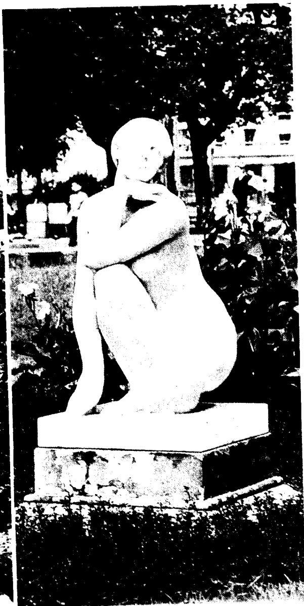
Fig. 6. Josep Clará. Diosa . Barcelona. Plaza de Cataluña.