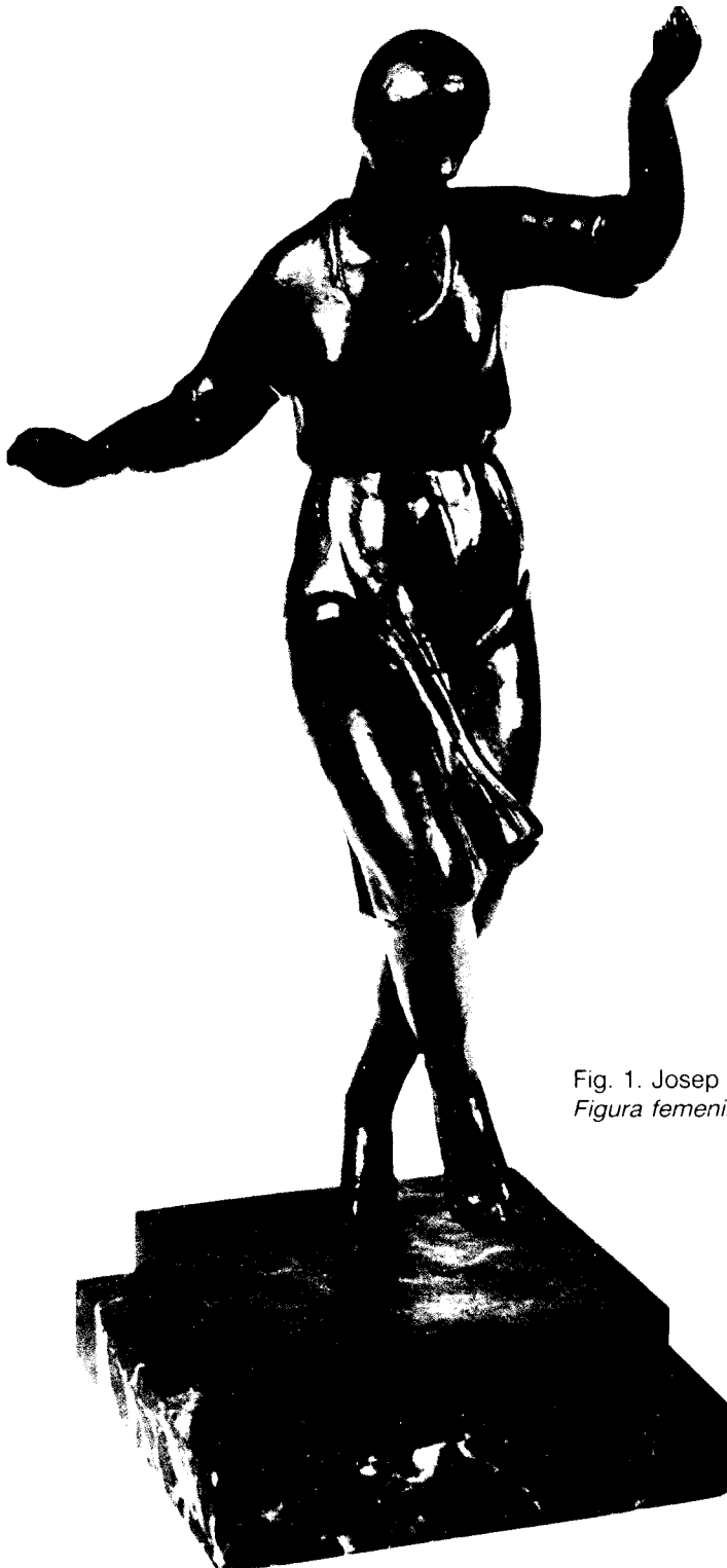
Fig. 1. Josep Amengol. Figura femenina.