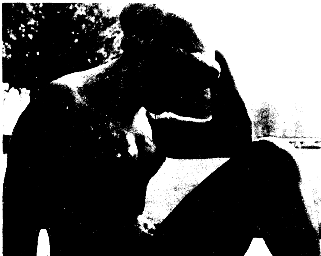
Fig. 4. Aristides Maillol. Mediterránea .

«Cuando MAILLOL realizó, en 1900, una mujer sentada, robusta, reposada y perfecta, tituló significativamente a aquel desnudo Mediterránea . Con ella había esculpido no sólo la que tal vez sea su mejor obra, sino indiscutiblemente el programa estético de la escultura catalana noucentista. Constituye un extraordinario ejemplo de formas cacizas, superficie lisa y contorno continuo, expresión de los volúmenes esenciales. El volumen de cada detalle plástico recuerda una forma geométrica: así, los senos parecen conos redondeados, y brazos y piernas, cilindros de diámetro variable. Armonía y equilibrio estáticos presiden una esencialidad inerte de tradición griega.»