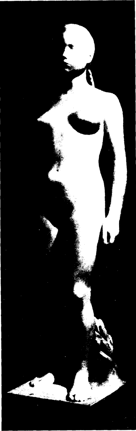
Fig. 17. Llorenç Cairó. Desnudo de pie.

«Una de las notas más significativas de la escultura noucentista es el predominio casi absoluto del desnudo femenino como tema. La práctica totalidad de los grandes escultores noucentistas, desde MAILLOT a REBULL, desde CLARÀ a VILADOMAT, cultivaron básicamente el modelado sincero y directo del cuerpo desnudo de la mujer mediterránea casi como única fuente de inspiración. Consideran el desnudo femenino como el tema omnipotente que les permite conquistar las armonías de volumen y superficie más perfectas».