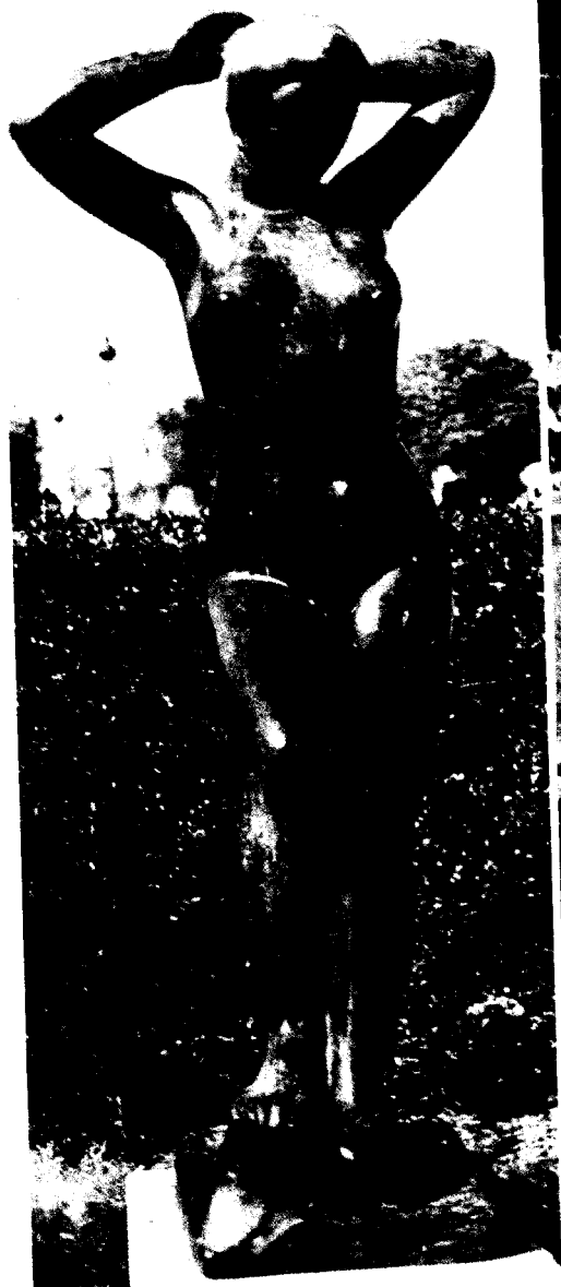
Fig. 5. Aristides Maillol. Bañista con los brazos levantados . París. Jardín de las Tullerías.

«Aristides MAILLOL y Josep CLARÁ triunfan con sus admirables desnudos de «diosas» que alzan sus formas triunfantes bajo el sol mediterráneo, a la orilla del mar azul, en las ágoras o en los jardines.»