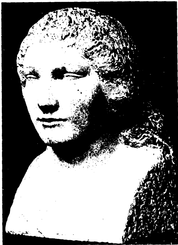
Figs. 11, 12 y 13. Enric Casanovas. Cabezas.