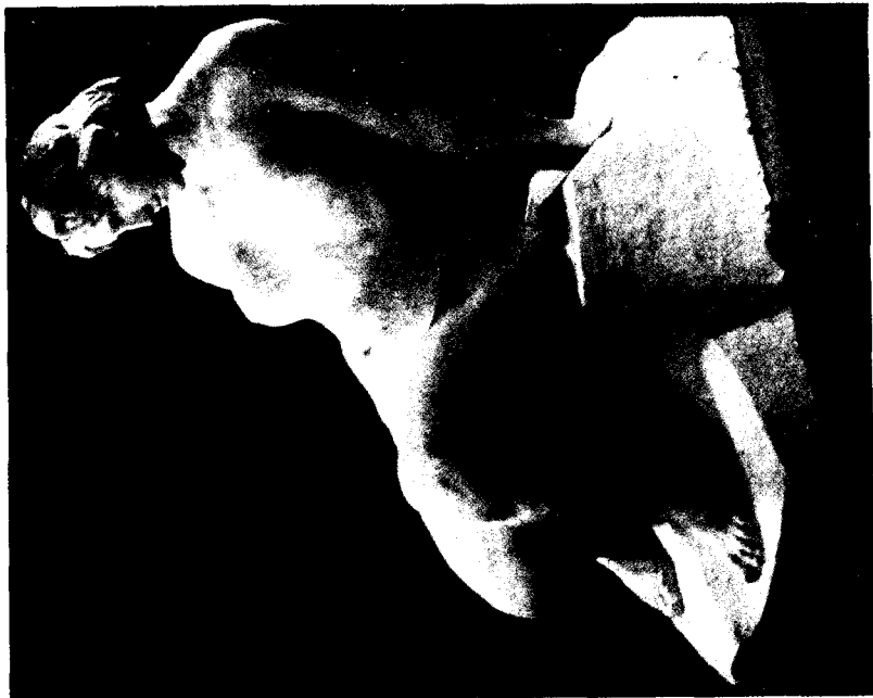
Figs. 2 y 3. Josep Clarà. El crepúsculo y Cadencia.

«Los escultores noucentistas supieron cultivar un clasicismo muy euritmico.»