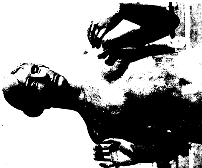
Fig. 10. Aristides Maillol. Venus (detalle).