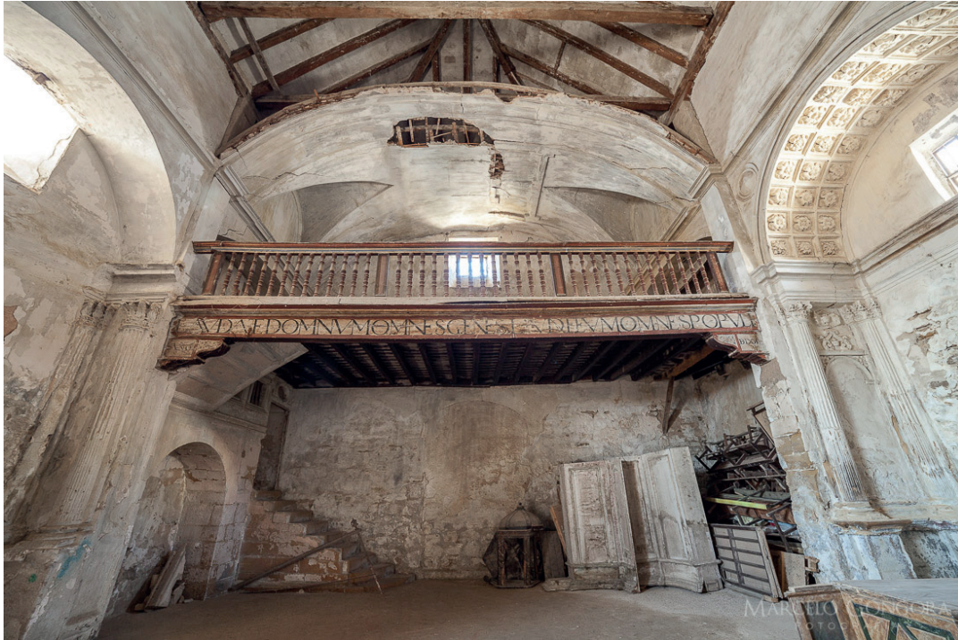
FIGURA 10. CORO ANTES DEL INICIO DE LAS OBRAS DE RESTAURACIÓN.

del destino (Hospital de San Antón Abad, Iglesia de San Juan de los Huertos, Arco del Santo Cristo...).