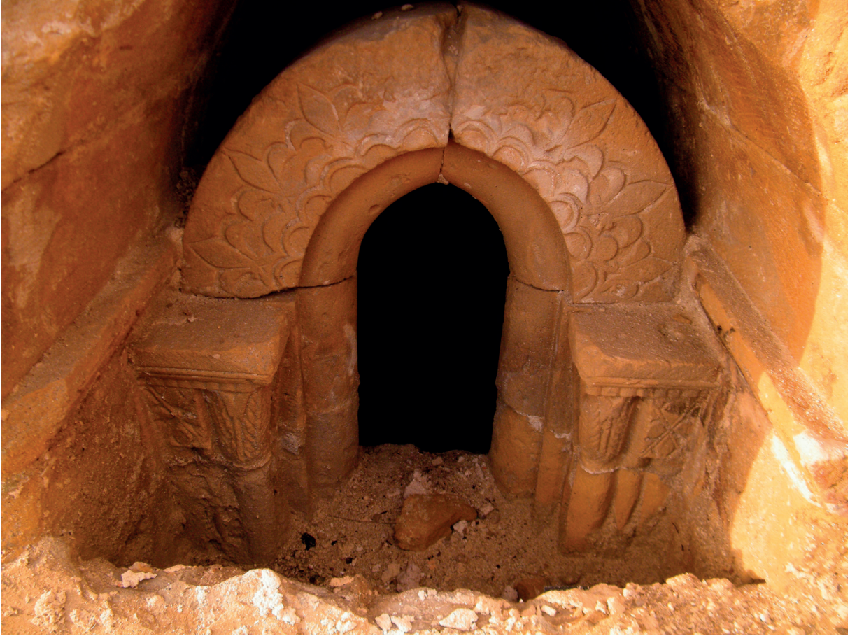
FIGURA 5. ARCO GÓTICO-MUDÉJAR.