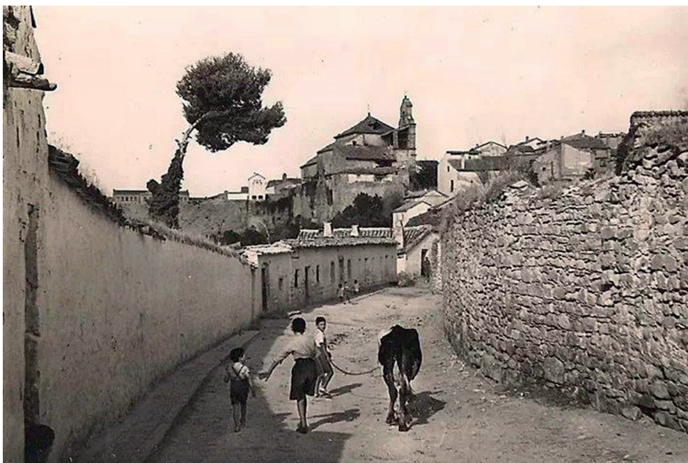
FIGURA 13. VISTA DE SAN LORENZO DESDE LA CALLE COTRINA (HACIA 1920).

En los primeros años del siglo XX el templo se encontraba abierto al culto dominical como ayuda de la parroquia de Santa María, estando servida por un capellán y abriéndose puntualmente para alguna celebración religiosa. Por esta época surgen los primeros estudios históricos en Úbeda y, curiosamente, la gran mayoría de autores se olvidan de la iglesia de San Lorenzo y se centran en otros monumentos de la ciudad. El único autor que le dedica un estudio más extenso a la iglesia es Miguel Ruiz Prieto, teniendo igualmente algunas referencias aisladas por parte de Manuel Campos Ruiz; por su parte, Enrique Romero de Torres 40 no habla nada de San Lorenzo en su Catálogo monumental y tan sólo refiere algunas de las piezas del templo diseminadas por el resto de la ciudad. También por estos años se producen las primeras vistas urbanas de Úbeda, siendo la iglesia nuevamente olvidada por fotógrafos como Arturo Cerdá y Rico (h. 1900-1910), Alberto Martín (1913-1915), Luciano Roisin (1917-1918), Pelayo Mas (1923-1927), etc., 41 quienes sí fotografían ampliamente el resto de monumentos ubetenses; tan sólo tenemos vistas aisladas en varias fotografías sueltas, generalmente más centradas en las murallas que en la iglesia de San Lorenzo (Figura 13)