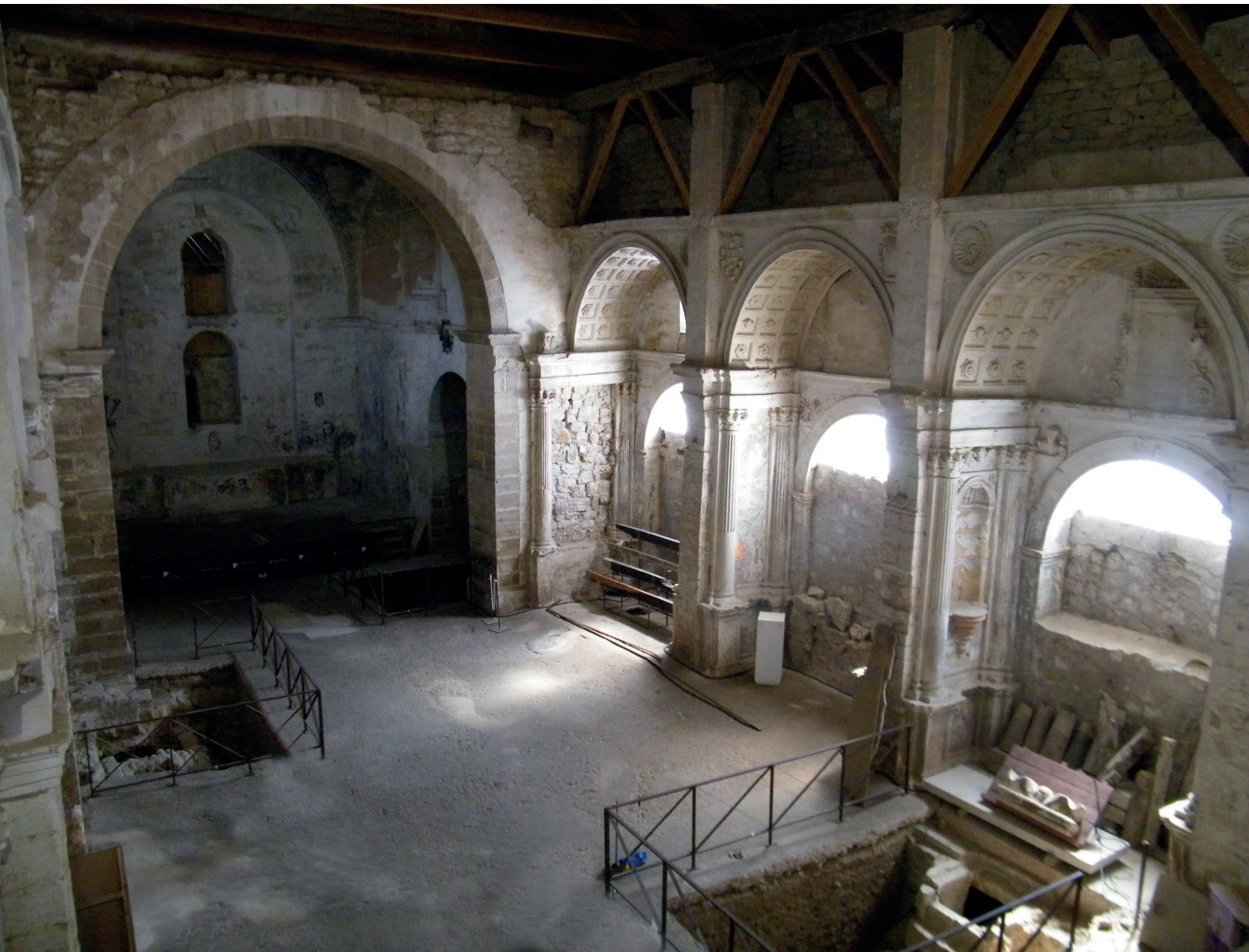
FIGURA 7. INTERIOR DE LA IGLESIA DE SAN LORENZO.