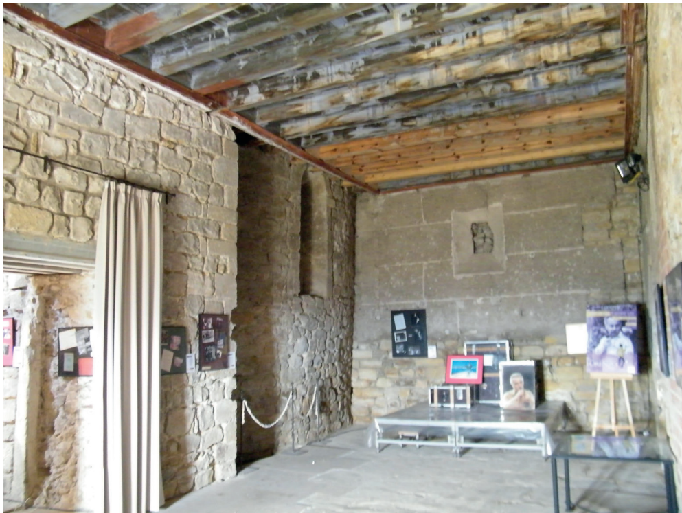
FIGURA 12. SACRISTÍA Y ÁBSIDE ROMÁNICO. (Fotografía del autor).