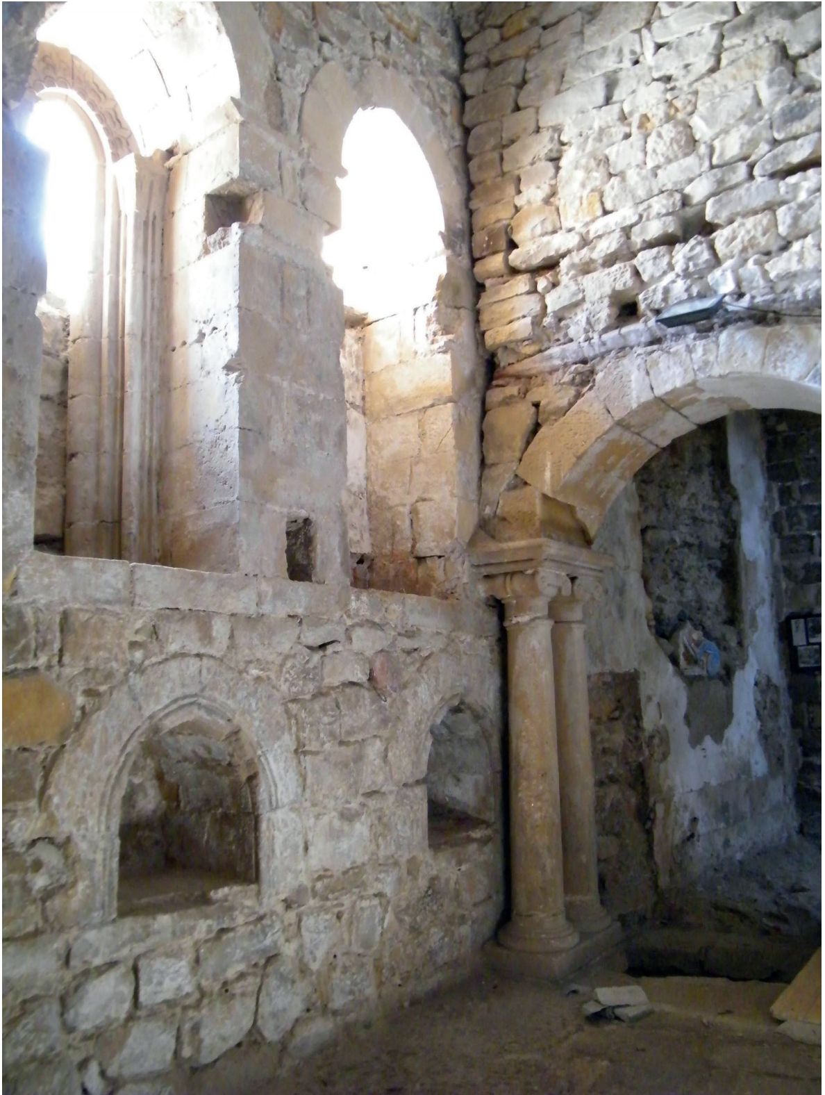
FIGURA 4. ANTESACRISTÍA.