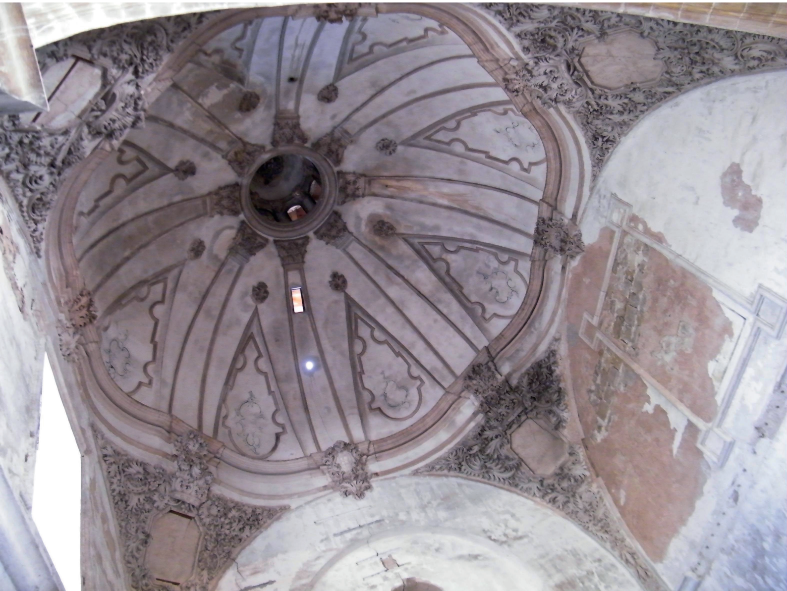
FIGURA 9. BÓVEDA BARROCA DE LA CAPILLA MAYOR.

tras el cierre de la parroquia, dan muestra de que las bóvedas estaban policromadas, al igual que los paramentos del templo (donde aún se conservan algunos restos). 29