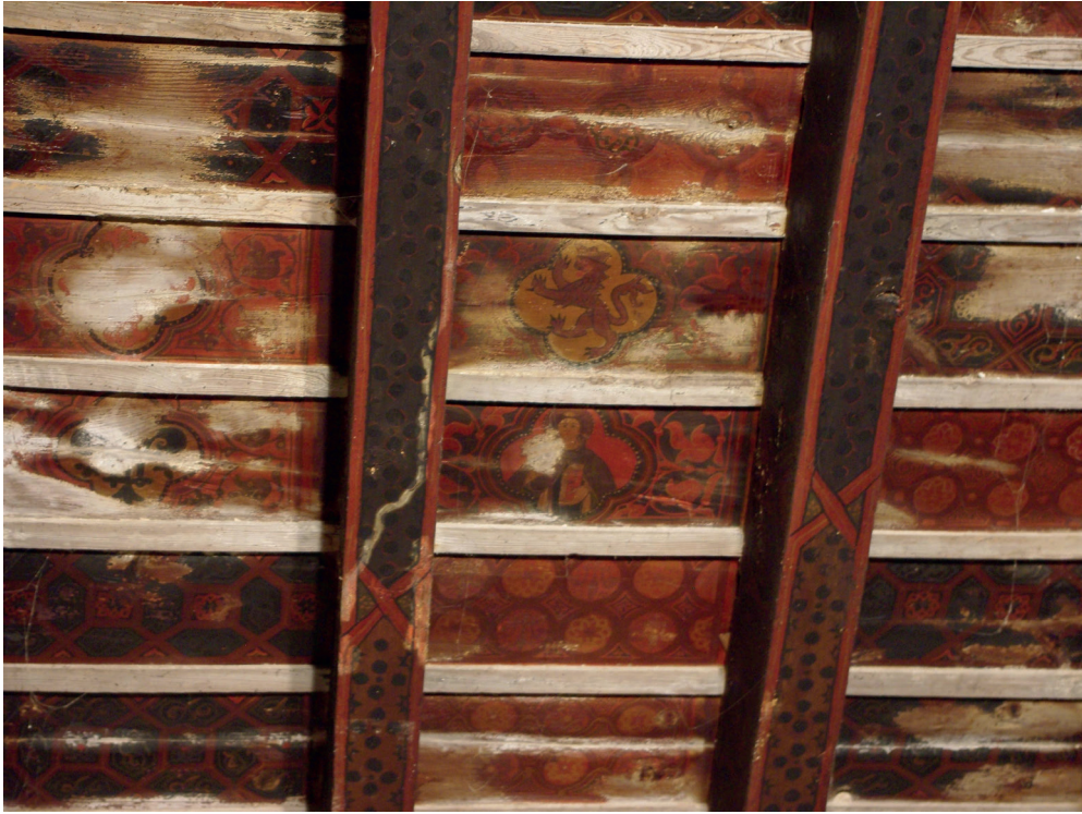
FIGURA 11. SOTOCORO.