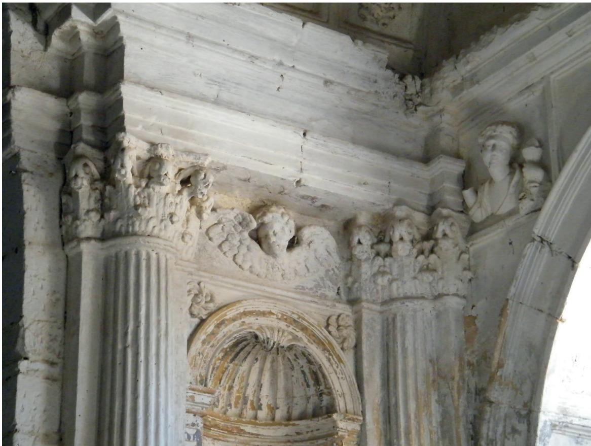
FIGURA 8. DETALLE DE LA CAPILLA DEL PRIOR VIEJO.

suministrar toda la piedra precisa (rasa, moldurada o tallada), iguales a la de la capilla modelo siguiendo las plantillas proporcionadas por el albañil para dicho trabajo. 24