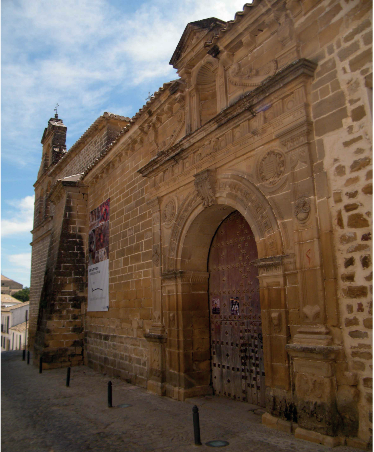
FIGURA 6. PORTADA PRINCIPAL.