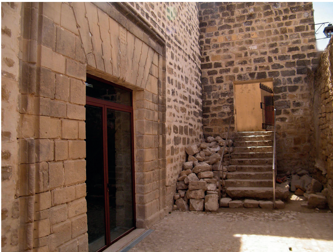
FIGURA 3. PORTADA DE LOS PIES EN EL HUERTO-CEMENTERIO.

(oculto por una pared de la sacristía), que serían ocultadas durante la intervención efectuada en la capilla mayor en el siglo XVIII.