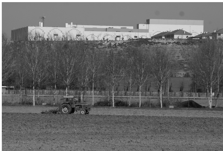
6. Soto Histórico de El Rebollo. Al fondo la zona de expansión urbanística La Montaña.

Por una parte, respecto de la conservación y al hilo de ciertas carencias detectadas, se plantean iniciativas, así la declaración de la Plaza y Arcos de San Antonio como Bien de Interés Cultural en 2002 45 y la incoación del expediente para el Hospital de San Carlos en 2010 46 . A ello se suma aquí el proponer al Comité de Patrimonio Mundial la inclusión del Real Cortijo de San Isidro (el modelo de ciudad rústica del XVIII) en el área protegida del Paisaje Cultural de Aranjuez, que inexplicablemente quedó fuera de la propuesta del año 2000 aun siendo señalada como elemento clave del paisaje cultural. En este sentido y desde estas líneas se advierte sobre un elemento fundamental que hasta la fecha ha quedado fuera de valoración y que habría de ser incorporado en un futuro: el patrimonio industrial. Edificios como la Estación de Telegrafía (de los años veinte, desaparecida en 2000) o la Azucarera (1899) no están protegidos en el Catálogo correspondiente del PGOU de 1996; el trazado histórico del ferrocarril (segunda línea de España) ha sido analizado desde el punto de vista del impacto que supone su cruce por Picotajo, zona de calles arboladas del siglo XVI, pero no como testimonio de un hito fundamental de los avances tecnológicos y de las comunicaciones del XIX. Algo parecido sucede con el cementerio decimonónico o el antiguo matadero municipal