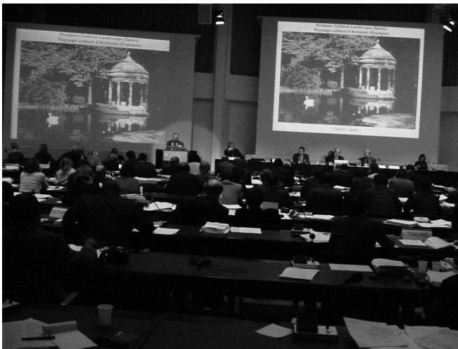
5. Helsinki. 25 º Comité de Patrimonio Mundial. Presentación del Paisaje Cultural de Aranjuez.

rectrices Prácticas de 1999 y las de 2005 se observa el cambio en la definición de paisaje cultural. Aranjuez se defendió sobre el artículo 39 de las Directrices de 1999 («es el tipo de paisaje más fácilmente identificable, es el paisaje claramente definido diseñado y creado intencionadamente por el hombre. Estos implica paisajes de parques y jardines contruidos por motivos estéticos los cuales a menudo (no siempre) se asocian con edificios y conjuntos religiosos o de otro tipo» 30 ); mientras que en las Directrices de 2005, en su artículo 47, los paisajes culturales «son bienes culturales y representan las «obras conjuntas del hombre y la naturaleza» citadas en el Artículo 1 de la Convención, ilustran la evolución de la sociedad humana y sus asentamientos a lo largo del tiempo, condicionados por las limitaciones y/o oportunidades físicas que presenta su entorno natural y por las sucesivas fuerzas sociales, económicas y culturales, tanto externas como internas» 31 . Obviamente, el concepto de Paisaje Cultural de 2005 es el que define Aranjuez, un concepto más novedoso (más acorde a la definición de paisaje del Convenio Europeo del Paisaje que se revisará más adelante) que trasciende la tradicional valoración estética y monumental.