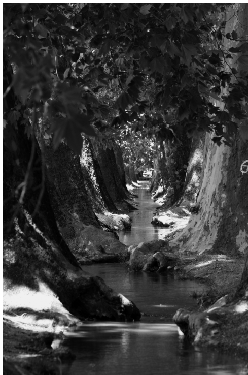
3. Calle de la Reina (siglo XVI). Sistema de riego.

fue del todo preciso, pues tal vez el factor de riesgo más importante en Aranjuez sea el de la expansión urbanística, desproporcionada para su crecimiento demográfico moderado y de mayor impacto que una industria de desarrollo medio en una ciudad en la que los servicios y el comercio tienen cada vez más clara su vocación cultural y turística.