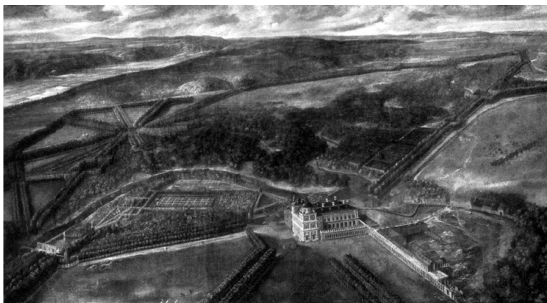
1. Vista de Aranjuez. Anónimo fines XVI. (Museo del Prado. Madrid).

Aranjuez es el primer paisaje cultural de España inscrito como tal en la Lista de Patrimonio Mundial 2 . Se trata de una categoría que a la altura de 2010 cuenta con sólo 66 declaraciones en el mundo 3 , una distinción que la UNESCO reserva para aquellos espacios que son el resultado de la conjugación de la naturaleza y la obra del hombre. Este dato es fundamental porque va a determinar la singularidad de Aranjuez entre los bienes españoles que forman parte de la Lista de Patrimonio Mundial. Si se tiene en cuenta que los bienes españoles declarados corresponden a categorías como ciudades (Toledo, Salamanca), sitios arqueológicos (Pintura Rupestre del Arco Mediterráneo, Tarragona), edificios singulares (Catedral de Burgos) o paisajes naturales (Pirineos) por comparación el paisaje de Aranjuez evidencia su complejidad: la zona protegida es una superficie de 2.047,56 Ha. integrada por un espacio natural alrededor de dos ríos, una zona de huertas, sotos y calles arboladas, un conjunto de palacio y jardines y una ciudad (casco histórico).