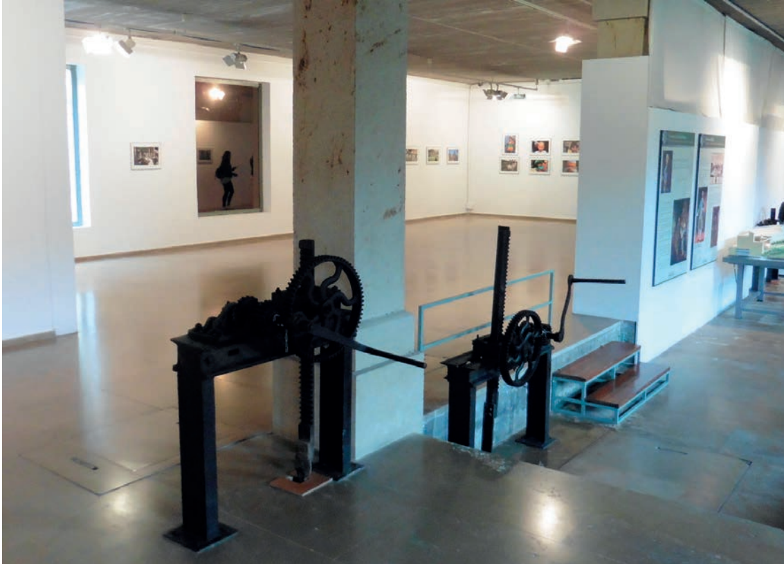
FIG. 6. DETALLE DE UNA DE LAS TRES SALAS DE EXPOSICIONES CON QUE CUENTA EL ACTUAL MUSEO UBICADO EN EL ANTIGUO COMPLEJO MOLINAR.

de velar por la correcta distribución de los caudales en el regadío histórico; y, por último, c) el reconocimiento del Bando de la Huerta como Fiesta de Interés Turístico Internacional , hecho que tuvo lugar en 2012 y cuya manifestación lúdico-festiva reconoce el significado y atractivo que para el turismo tiene esta manifestación que se viene celebrando desde 1851.