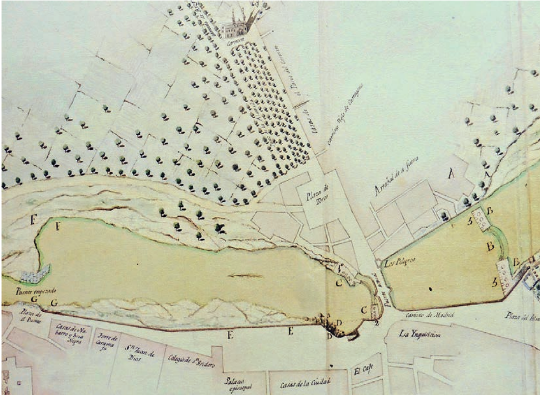
FIG. 1. PLANO ELABORADO EN 1784 POR MANUEL SERRANO, DONDE SEÑALA LOS MOLINOS HIDRÁULICOS EXISTENTES AGUAS ARRIBA Y ABAJO DEL PUENTE DE LOS PELIGROS EN MURCIA.