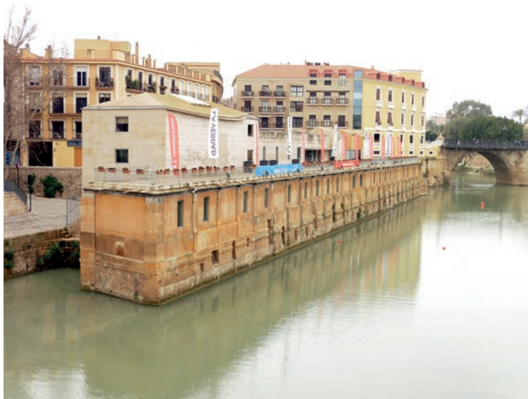
FIG. 3. VISTA EXTERIOR DEL MUSEO HIDRÁULICO MOLINOS DEL RÍO SEGURA EMPLAZADO LONGITUDINALMENTE AL CURSO DEL RÍO..

ampliándose posteriormente a veinticuatro en 1808. El molino estuvo en funcionamiento hasta la segunda mitad del siglo pasado y es el que con ligeras modificaciones ha llegado hasta nuestros días adaptado como museo.