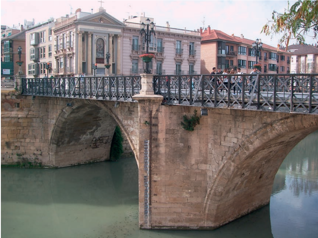
FIG. 5. PUENTE VIEJO DEL SIGLO XVIII Y TRAS ÉL LA HORNACINA QUE ALBERGA LA VIRGEN DE LOS PELIGROS, PROTECTORA CONTRA EL SECULAR RIESGO DE INUNDACIÓN DEL RÍO SEGURA.

que mueve las piedras), tres salas destinadas a exposiciones temporales; la de mayor tamaño situada en las antiguas cuadras y conocida con el nombre de Caballeriza, edificio anexo que ocupa una superficie de 150 m 2 . Estas estancias mantienen una programación anual centrada principalmente en muestras fotográficas de diverso tipo y alejadas del contenido específico del señalado museo.