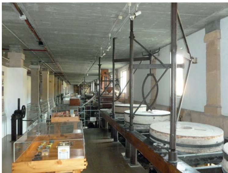
FIG. 4. PERSPECTIVA INTERIOR DE LA BATERÍA DE 24 PIEDRAS DESTINADAS A LA MOLIENDA.

El Museo Hidráulico está emplazado en pleno centro de la ciudad de Murcia, en la orilla opuesta a la Glorieta de España donde se encuentra el Ayuntamiento; se accede a él atravesando el Puente Viejo o de Los Peligros cuya fábrica de sillares es de la misma centuria aunque levantado casi medio siglo antes reemplazando a otro que quedó igualmente destruido por la riada de San García en 1701. El citado viaducto, emplazado en el Camino Viejo a Cartagena, conectaba la ciudad amurallada con la Huerta sur y dio origen en el XVIII a una ampliación urbana tras la mota del río, el Barrio del Carmen, originando un primer espacio público de planta ortogonal -la Plaza de Camachos- desde la que se desciende al edificio molinar. La protección divina frente a los desastres naturales y más concretamente el riesgo inundación, se hace patente en este lugar mediante la presencia en uno de los edificios junto al puente de una gran hornacina de estilo neoclásico de dos pisos de altura que alberga en su interior una talla de la virgen en cuyo entablamento se lee « Salus in Periculis ».