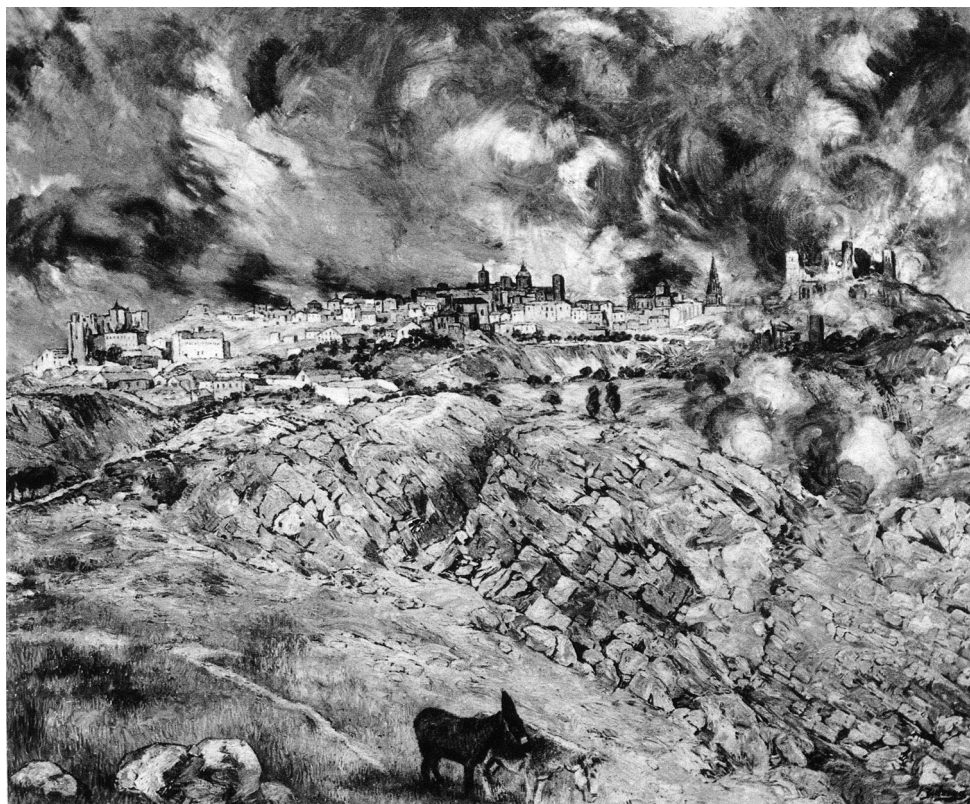
Ignacio de Zuloaga: El Alcázar en llamas, óleo/lienzo, 1938.

Quizá no falte razón a los autores en un punto: en 1996, cuando estas palabras fueron escritas, la leyenda del Alcázar ejercía ya muy escasa influencia en la vida política del país. Sin embargo, la cita sugiere el divorcio entre las creencias populares, conformes grosso modo con la leyenda auspiciada por el régimen, y las versiones en su mayor parte admitidas por los historiadores, contrarias a aquélla. Esto