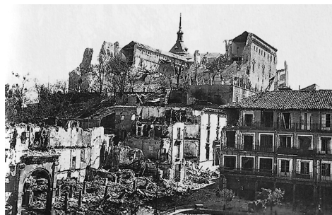
Antes de la explosión de minas del 18 de septiembre de 1936.