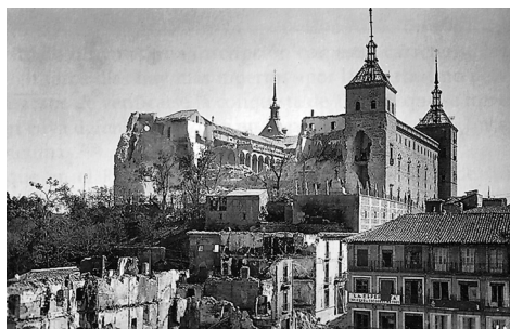
Tras el bombardeo, la torre NE se derrumba el 4 de septiembre de 1936.