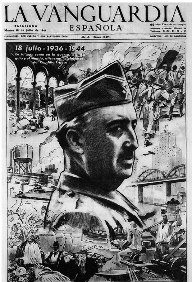
Rafael de Penagos. Portada de La Vanguardia Española , 18 de julio de 1944.

No fue esto lo que ocurrió con el Alcázar de Toledo: aunque la conformidad del mito con los hechos arrojaba desde muy pronto un balance de desajustes escandaloso, muy a pesar de los denodados esfuerzos de Manuel Aznar y otros por dar apariencia científica al mito ( contradictio in terminis ), éste parece haber gozado de cierto predicamento en amplias esferas de la población, mientras que en la comunidad científica ocurría a la inversa, incluso en ocasiones (¿por qué no decirlo?) erróneamente. 22