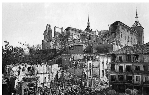
La torre NO se derrumba el 8 de septiembre de 1936.