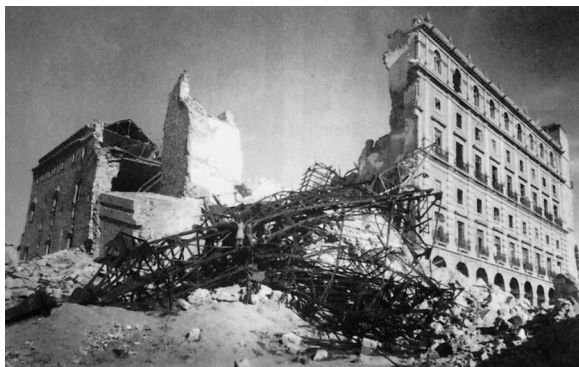
Después del asedio y «liberación».

El Alcázar de Toledo tuvo un papel privilegiado en esta batalla simbólica: construyó un héroe poco molesto que en absoluto podía hacer sombra a la estrella fulgurante del momento, Franco; estuvo poco coloreado ideológicamente en relación con las disensiones que vivía el bando nacional, cediendo todo protagonis-