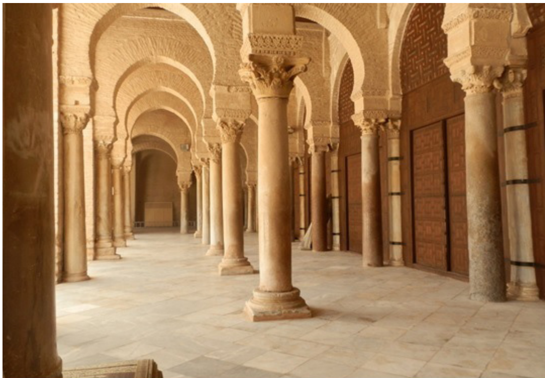
FIG. 1. UNO DE LOS PÓRTICOS DE LA GRAN MEZQUITA DE KAIRAWAN, DONDE SE REUTILIZAN MUCHAS DECENAS DE FUSTES Y DE CAPITULES ROMANOS. Foto del autor (2013).

las villas rurales africanas, que eran naturalmente complementarias a los espacios urbanos característicos de la civilización romana 4 . Pero también la visita a otros Museos del Magreb, como el Musée National des Antiquités de Argel, o los de Tipasa y Cherchel, o los de Marruecos, como los de Rabat, Tánger o Tetuán, ofrecen una visión parcial de la presencia romana en estos países y aparentemente al menos confirman la impresión de la existencia de una floreciente civilización.