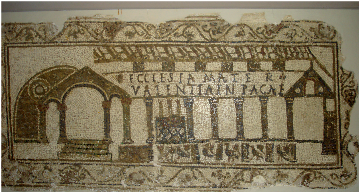
FIG. 5. MOSAICO FUNERARIO ROMANO CON LA REPRESENTACIÓN DE UNA IGLESIA. Museo del Bardo de Túnez. Foto del autor (2013).

emblemático estudio de Frensd 64 , al más reciente de Shaw 65 , las investigaciones sobre las relaciones del cristianismo con el judaísmo, como vemos en la monografía de Aziza 66 , Igualmente debemos destacar los múltiples y valiosos trabajos recientes de González Salinero 67 , así numerosos trabajos centrados en San Cipriano y en otros personajes importantes del cristianismo norteafricano de la antigüedad 68 . De todas formas, debemos indicar que siempre es San Agustín el cristiano norteafricano que más atención ha atraído, por lo que los estudios sobre sus obras son innumerables, al igual que son numerosos los que analizan la obra de Tertuliano.