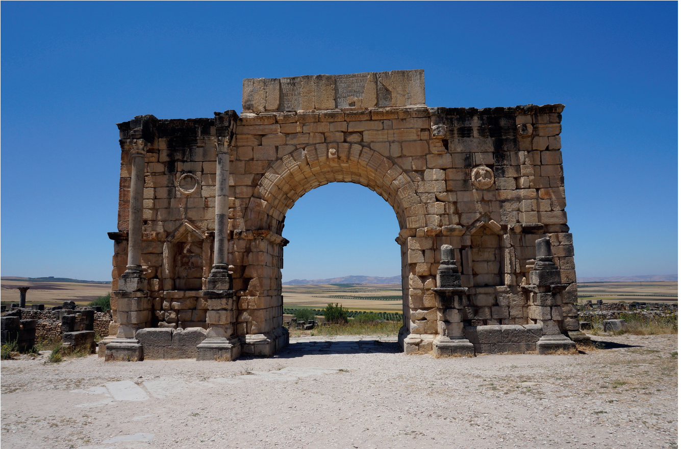
FIG. 3. ARCO DEL TRIUNFO DE LA CIUDAD ROMANA DE VOLUBILIS (MARRUECOS).