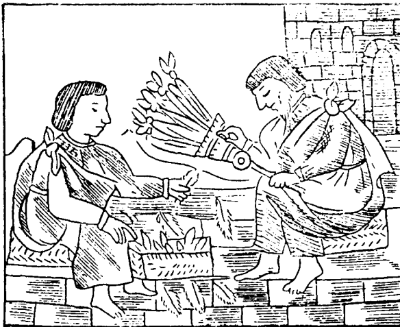
Fig. 6. Maestro y aprendiz de arte plumaria (Códice Florentino)

Nos podríamos preguntar si algo parecido ocurre con las obras de arte, las cuales no consistirían en representaciones de la esfera de lo sagrado, sino en la materialización misma de ese ámbito superior. El artista sería el equivalente al chamán, quien conoce, traduce la esencia y atributos de la divinidad y hace posible que el simple humano acceda a la esfera de lo sagrado, plasmada en este aspecto en las obras artísticas: en ambos casos, se necesita un guía que posea las claves de un saber reservado a unos elegidos, maneje los recursos necesarios para que el trance sea fructífero y sea capaz de convertir en un lenguaje accesible lo que en principio está más allá del raciocinio. Chamanes y artistas acusan varios rasgos definitorios comunes: pertenecen a ese status que hemos denominado marginalidad privilegiada; su aprendizaje incluye aspectos técnicos y educación en las tradiciones; su actividad se halla fuertemente