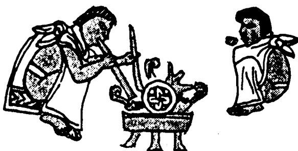
Fig. 3. Las técnicas de la orfebrería se transmitían de padres a hijos (Códice Mendoza)

Tula, fundada hacia mediados del siglo x d. C., había conocido un gran desarrollo como centro metropolitano en el Altiplano mexicano. Continuada, en cierta medida, de la tradición de grandes ciudades inaugurada en esta zona de Mesoamérica por Teotihuacán, las noticias que sobre