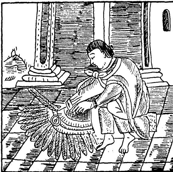
Fig. 7. «Amanteca» realizando un penacho de plumas (Códice Florentino)

Tenemos, por tanto, un panorama en el que la producción artística se inscribe de manera singular. Actividad al servicio del poder, encierra, en cuanto a su práctica, una consideración privilegiada, tanto en lo que se refiere a los artistas propiamente dichos como a la posibilidad de que gentes pertenecientes a las clases altas lo practicaran. En tanto que discurso estructurado, su concepción y realización estarán en función del mantenimiento de un orden que rebasa la contingencia material: el orden social, el orden político, se consideran el reflejo del orden cósmico. El arte servirá para mantener el orden, perpetuar la tradición, proclamar la supremacía de un pueblo que se dice elegido. Pero, a su vez, todo ello estará en función del mantenimiento del equilibrio cósmico. De ahí su contenido eminentemente religioso, trascendente, como plasmación material de ese orden superior, de ese ámbito de lo sagrado. Y el artista será quien posibilite esa materialización: sus poderes, sus cualidades, se sustentan en un pasado histórico que reclama para sí la herencia de los toltecas, pero que a su vez se remontan al tiempo de los orígenes, al momento primigenio, último eslabón de una concepción mitopoética inherente a cualquier fenómeno.