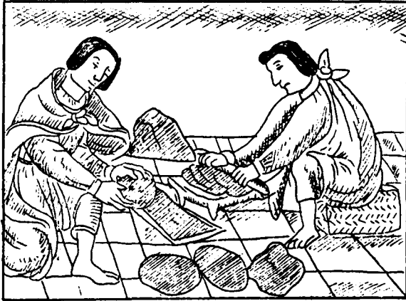
Fig. 4. Orfebres preparando moldes de barro y polvo de carbón para sus piezas (Códice Florentino)

tecas. De acuerdo con Sahagún (1979: lib. X, cap. XXIX), la palabra «tolteca» significa «oficiales primos», los cuales poseían encomiables virtudes: excelentes constructores, diestros joyeros, oficiales curiosos y pulidos, trabajaban además el barro y la piedra, fabricaban juguetes, elaboraban complicadas obras de pluma, conocían las cualidades y virtudes de las hierbas, habían sido los primeros inventores de la medicina, descubrieron y usaron las piedras preciosas, poseían ingenio natural y se adentraban en los vericuetos de la filosofía, dominaban las artes mecánicas (pintura, escultura y talla, carpintería, encalado, plumaria, tejido), sabían todo sobre minas de oro, plata, cobre, plomo, oropel natural, estaño, ámbar, cristal, amatista y perlas, conocían los secretos de la astrología natural, interpretaban sueños, sabían de astronomía y teología y, por si con eso no bastara, eran altos, hermosos, buenos cantores, veraces, virtuosos y educados.