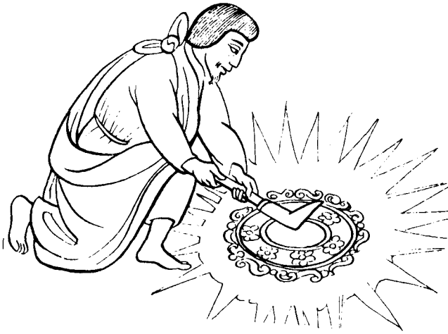
Fig. 5. Orfebre (Códice Florentino)

hacer, refinamiento y lujo de la otra esplendorosa ciudad se va a conservar en ciertos enclaves enriquecidos por la aportación de los toltecas recién llegados (NICHOLSON 1971: 113). Uno de estos enclaves, entre los que también cabría citar a Xochimilco (SOUSTELLE 1983: 77), será Culhuacán, una ciudad erigida por el mismo grupo tribal que había levantado Tula, y con la que las relaciones nunca dejaron de ser estrechas. En Culhuacán pervivirán en adelante muchas de las tradiciones toltecas: en palabras de Clavijero (1982: lib. II, 3) la memoria de la nación, la mitología, el conocimiento de las semillas y el cultivo de las artes. Y curiosa, pero nada casualmente, los aztecas entronizan en 1375 como primer «tlatoni», gobernante, a Acamapichtli, hijo de un noble azteca y de una joven princesa de la rama gobernante de Culhuacán. Acamapichtli encarnaba dos condiciones esenciales para el puesto: pertenecía por vía paterna a la rama de los «pipiltin» y enlazaba por vía materna con la nobleza establecida a orillas del lago desde hacía tiempo. Además se debe considerar que la sofisticación gubernamental que implica la entronización de un «tlatoni» es el reflejo de un refinamiento cultural más amplio y generalizado (PADDEN 1967: 9).