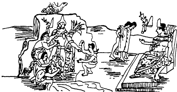
Fig. 1. Moctezuma Ilhuicamina dirigiendo los trabajos de los escultores que realizan su efigie en el bosque de Chapultepec (Código Durán)

Una vez establecidos definitivamente a orillas del lago y, sobre todo, a medida que su poder se acrecienta, van a reciclar de manera extremadamente eficaz todo aquello que les pudiera servir para sus fines. En el campo de la producción artística, no puede sorprender, por tanto, que las crónicas mencionen cómo eran llevados a Tenochtitlan artistas y escultores de estados vencidos para trabajar a las órdenes del nuevo poder (NICHOLSON 1971: 112-3). Además no lo hacían en obras de poca importancia, sino en monumentos señeros: Tezozómoc (1944: 115) informa que escultores de Coyoacán y Azcapotzalco, tras ser conquistados ambos territorios, fueron empleados para realizar el «temalácatl», enorme piedra utilizada en los sacrificios gladiatorios, para conmemorar la victoria de los aztecas sobre sus antiguos señores tepanecas. Y también habrían de instalarse en la ciudad especialistas de reconocido prestigio provenientes de los más variados lugares, los cuales incluso llegaban a formar en la urbe auténticas colonias en las que, amén de elaborar y vender sus productos, funcionaban como maestros e instructores de las nuevas generaciones en el dominio de las técnicas y recursos adecuados (TOWNSEND 1979: 39). Es el caso de los mixtecas, un grupo reputado por su pericia artística y de-