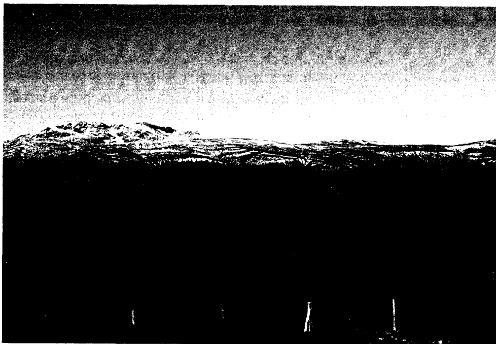
Figura 3. Macizo de Peñalara. Variabilidad cromática debida a la altitud.