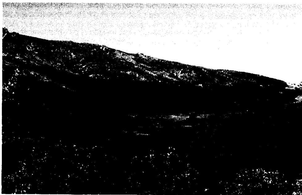
Figura 2. Puerto de la Morcuera. Variabilidad cromática debida a la vegetación.