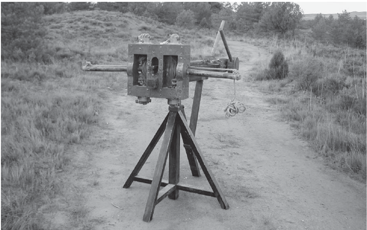
Fig. 4. Reconstrucción de la catapulta tipo scorpio de Rubén Sáez.