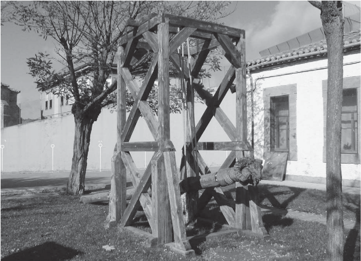
Fig. 3. Reconstrucción de un aries prensilis en Garray (Soria).