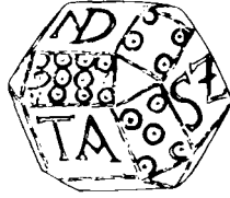
Fig. 2. Octodecaedro de la colección Martorell (según Almagro).