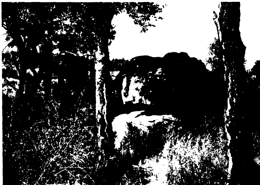
Fig. 2. Pedra Oscil·lant (Campmany, Alt Empordà).

i Ràfols, 1956; Barris i Duran, 1982a; Casanovas i Romeu, 1982; Mas i Cornellà, 1982; 1984-1985). Roca Guinarda (Oristà, Osona) (Barris i Duran, 1982b). Taula de les Creus (Rupit - Pruit, Osona) (Casanovas i Romeu, 1986b). Pedra del Mas Gili (Vilalleons, Sant Julià de Vilatorrada, Osona) (Casanovas i Romeu, 1986c) (fig. 3). Una pedra a Tavèrnoles (Osona) (inèdita) (fig. 4). Un bloc de pedra a Rocafort (El Pont de Vilomara i Rocafort, Bages) (Daura i Jorba - Galobard i Badal, 1983). Roca del Passarell (Moià, Bages) (Casanovas i Romeu, 1984). Una pedra a Collserola (Sant Cugat del Vallès, Vallès Occidental) (Mañé i Sàbat, 1987) (fig. 5). Pedra de les Creus (La Roca del Vallès, Vallès Oriental) (Bosch - Vila - Alacambra, 1985; Grup D'Arqueòlegs Independents, 1988:26) (fig. 6). Roca del Mas de N'Olives (Torreblanca, Ponts, La Noguera) (Diez-Coronel y Montull, 1982). Una balma a El Cogul (Les Garrigues) (Bosch Gimpera - Colominas Roca, 1921-1926). Roca de les Ferradures (Capafonts, Baix Camp) (Vilaseca, 1943b). Una cavitat a Els Castellots (Prades, Baix Camp) (Vilaseca de Pallejà, 1970). Coll de Creus (La Pobla de Montornès, Tarragonès) (Vilaseca, 1943b). Pujol Rodó (La Riera de Gaià, Tarragonès) (Vilaseca de Pallejà, 1970). Coll de la Mola (Rojals, Montblanc, Conca de Barberà) (Vilaseca, 1943b). Roca de Rogerals (Lloà, Priorat) (Vilaseca i Anguera, 1933; 1943b).