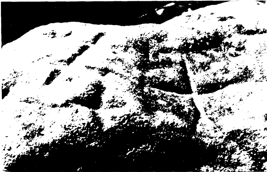
Fig. 6. Pedra de les Creus (La Roca del Vallès, Valles Oriental) (detall).