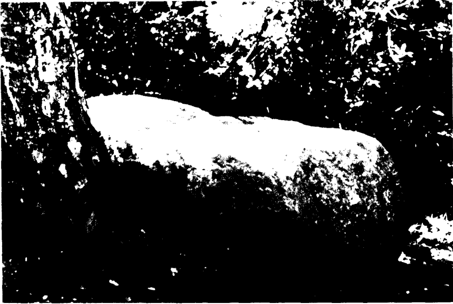
Fig. 5. Pedra de Collserola (Sant Cugat del Valles, Valles Occidental).