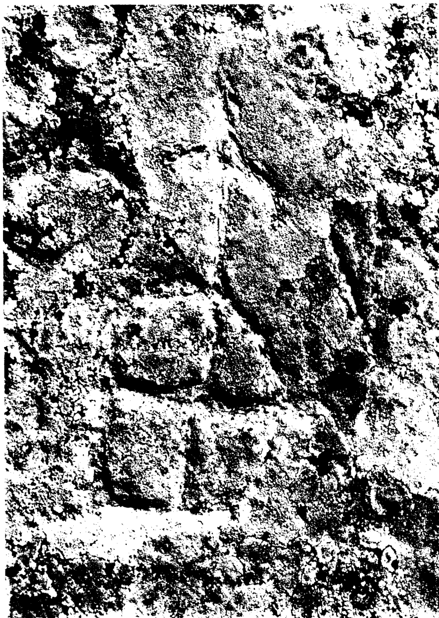
Fig. 1. Dolmen del Barranc d'Espolla (Alt Empordà) (detall).