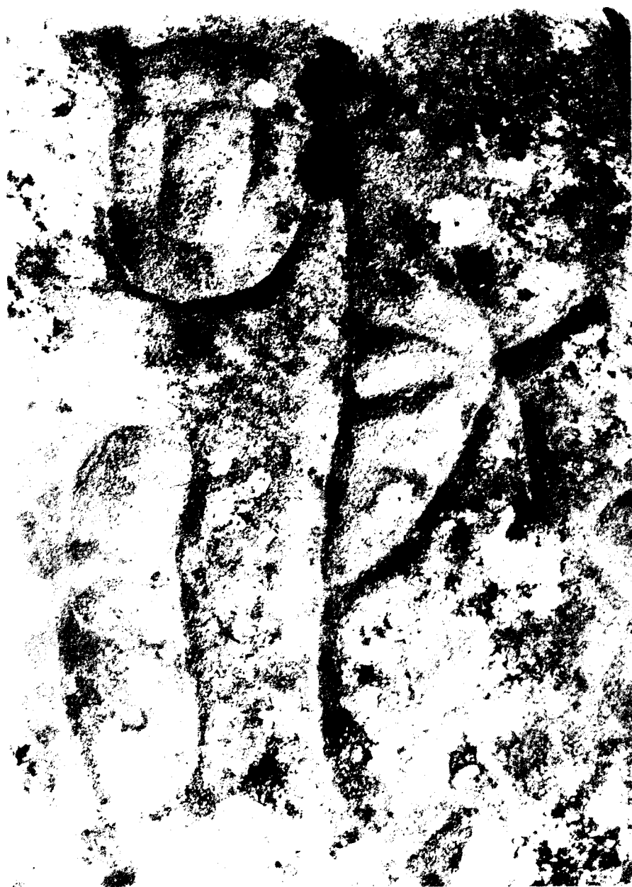
Fig. 7. Pedra 2 o «Pedra de les Bruixes» (Savassona, Tavernoles, Osona) (detall on es pot veure una de les combinacions d'elements).