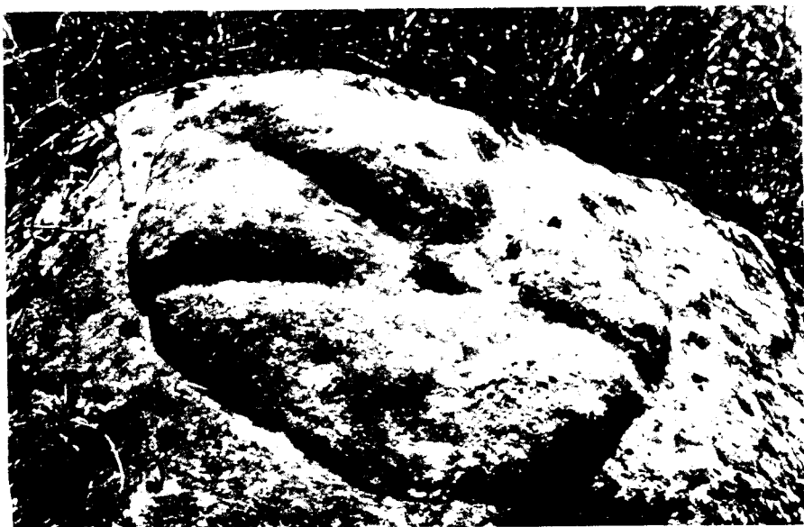
Fig. 4. Pedra de Tavernoles (Osona) (detall).