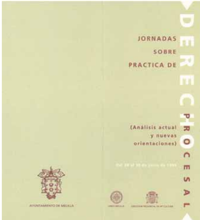
Fig. 8. I Jornadas sobre práctica de Derecho Procesal, UNED Melilla 1994.

premo, del Tribunal Constitucional, Fiscales Generales del Estado, Presidentes de la Audiencia Nacional, Presidentes de todas las Salas del Tribunal Supremo, Catedráticos relevantes en distintas materias, entre otros muchos brillantes juristas que se dan cita anualmente en estas Jornadas.