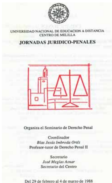
Fig. 3. Jornadas Jurídico-Penales (marzo 1988). Dibujo del pintor Eduardo Morillas.