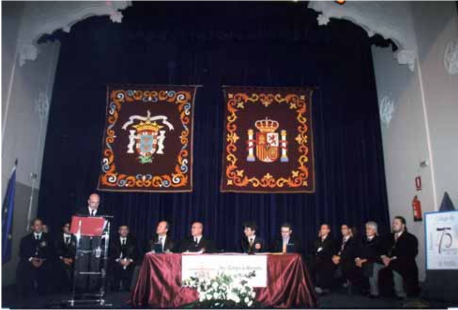
Fig. 18. Acto de la Patrona del Colegio de Abogados de Melilla el 17 de octubre de 2008.