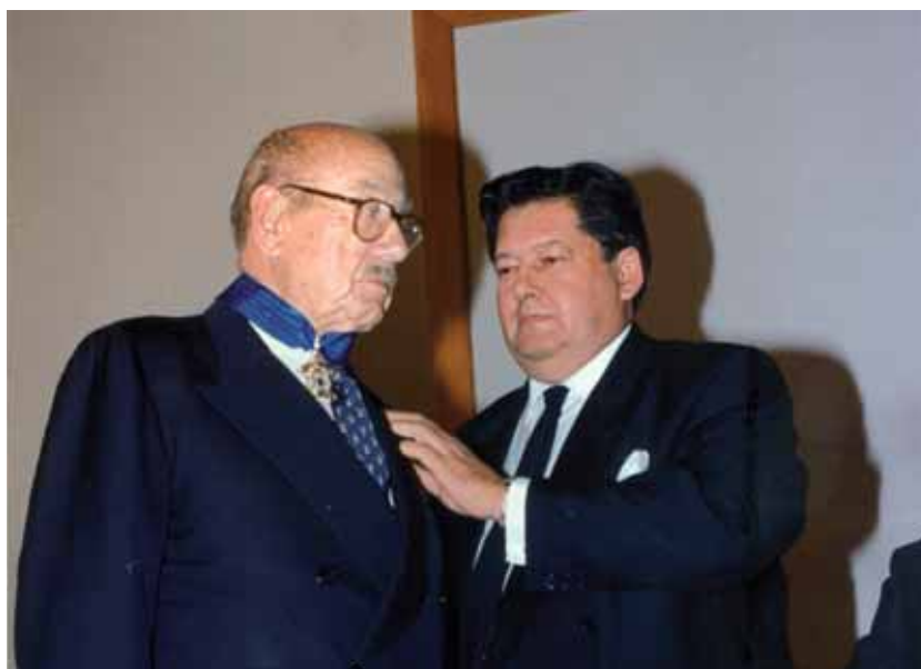
Fig. 16. Entrega de la Medalla de Oro del Colegio de Abogados a José Granados Weil, Presidente del Consejo de los Procuradores de los Tribunales de España por el Decano Pedro Luis Olivas Cabanillas el 22 de noviembre de 1996.