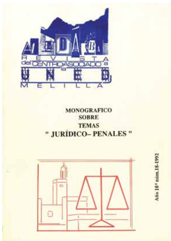
Fig. 5. Portada de la revista Aldaba nº 18, 1992.