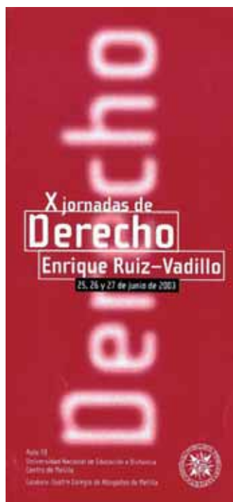
Fig. 9. Jornadas de Derecho Enrique Ruiz Vadillo (2003). A partir de estas X Jornadas tomaron el nombre de Enrique Ruiz Vadillo.