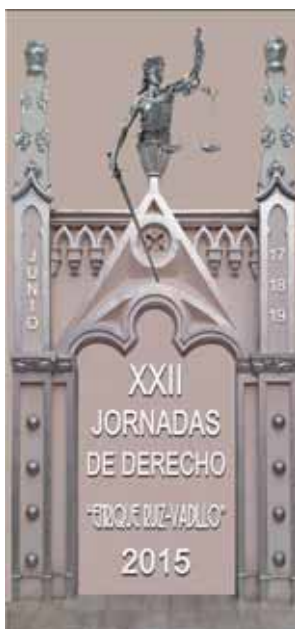
Fig. 13. XXII Jornadas de Derecho “Enrique Ruiz Vadillo”, 2015.