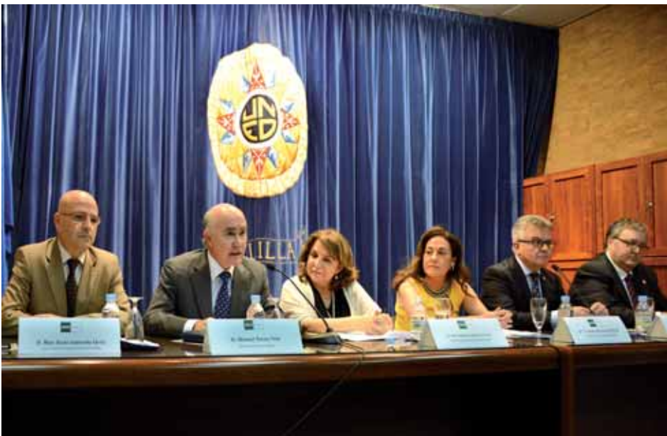
Fig. 19. Inauguración de las XXII Jornadas de Derecho, 2015.