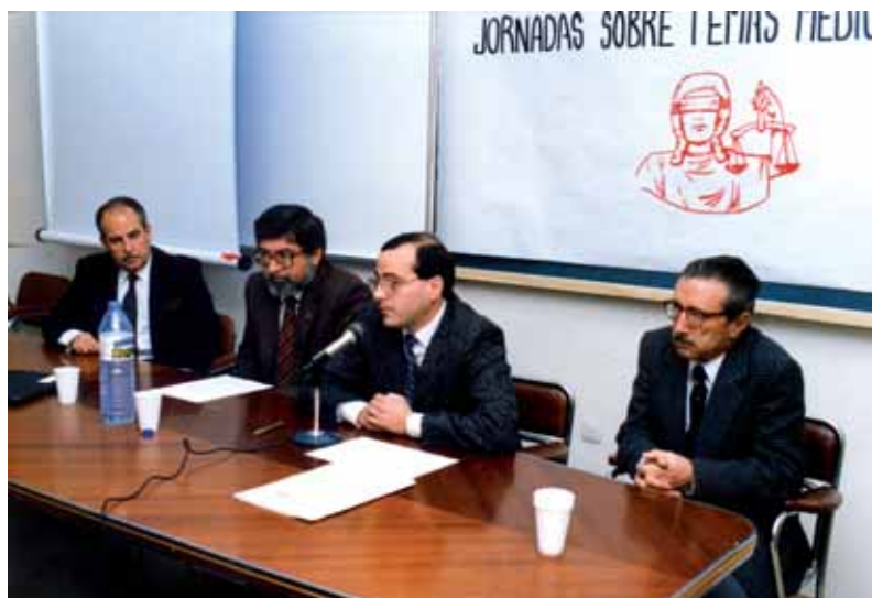
Fig. 2. Jornadas sobre temas médico-jurídicos. Marzo de 1987.