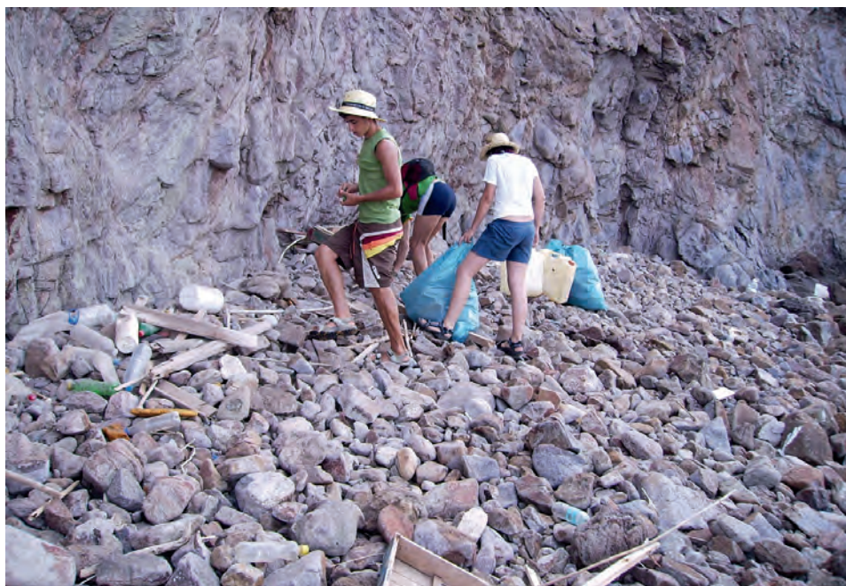
Recogida de residuos de las costas durante los campos de voluntariado en las islas.

en el mes de julio . Durante estos años de acción en las islas se distinguieron diferentes proyectos centrados básicamente en dos áreas concretas de la isla de Isabel II, el espacio adyacente a la Estación Biológica, lugar donde viven guardas y biólogos durante el año y el entorno del faro, lugar donde pernoctaban y convivían los jóvenes voluntarios.