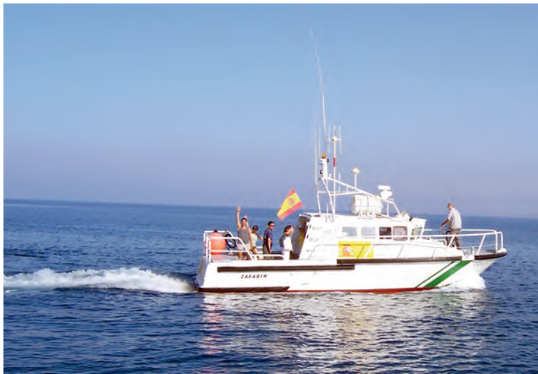
El barco de Parques Nacionales que transporta al personal a las islas fue bautizado con uno de los antiguos nombres de las Chafarinas, Zafarín.