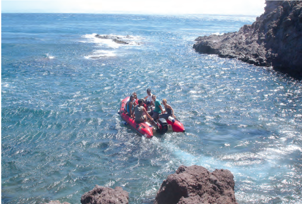
Evacuación del equipo de arqueología en zodiac desde la isla del Congreso a la de Isabel II cuando comenzaba a entrar un temporal de poniente.

La continuación del proyecto vino determinada por el éxito de esta primera excavación, pues confirmó la existencia de un importante lugar de hábitat del Neolítico antiguo cardial, con la existencia de estructuras domésticas (hogares, cubetas, etc.) y una asombrosa riqueza de materiales arqueológicos. Todo esto permitió establecer planteamientos futuros con sólidas aspiraciones científicas e ir perfilando la configuración de un equipo profesional. A su vez, comenzaron a surgir proyectos paralelos relacionados con el medioambiente, orientados a prestar apoyo a las venideras expediciones arqueológicas y que fueron sufragados y patrocinados por Parques Nacionales, la Consejería de Cultura de la ciudad autónoma de Melilla y la Fundación GASELEC.