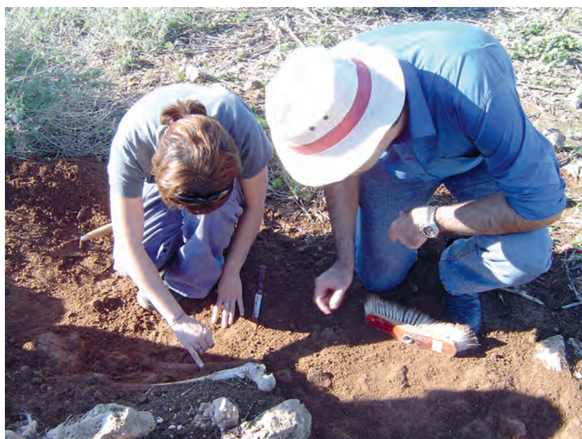
Intervención en la isla del Rey ante el descubrimiento de restos humanos durante las primeras prospecciones en diciembre de 2003.

de la isla, o la presencia de una construcción defensiva en la parte más occidental, en el sector sur. El espacio ocupado por estos banales, alrededor de una hectárea, iba a constituir una interrogante para el equipo de investigación, pues el hecho de no tener conocimiento de una ocupación humana posterior a época neolítica llevó a los investigadores a sospechar que esta construcción podría tener una cronología antigua y asociada al yacimiento prehistórico. Finalmente, durante la campaña de 2005 se realizó una intervención que dataría los aterrazamientos en época moderna.