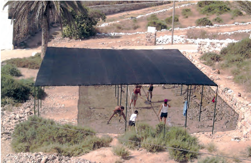
Construcción del vivero junto a la Estación Biológica en el año 2002.

Más adelante, este proyecto culminará con la construcción de un vivero de exterior para la fase intermedia de adaptación de las especies plantadas o un pequeño huerto para abastecer en ocasiones a la Estación Biológica.