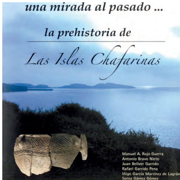
Catálogo de la exposición “Una mirada al pasado... la prehistoria de las islas Chafarinas”.

organismos e instituciones que tienen responsabilidad en las islas o que han creído interesante sus objetivos y logros.