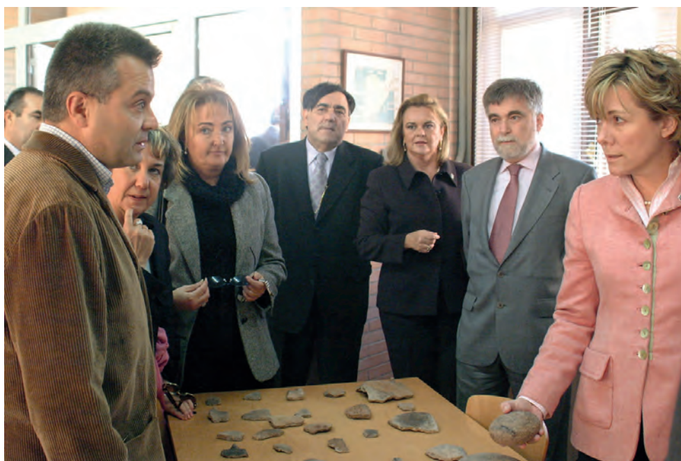
La ministra de cultura Pilar del Castillo en su visita al ICM, apreciando la colección de piezas rescatadas en las primeras campañas. 2002.

Un hito importante en este proceso fue la visita de la entonces ministra de Cultura, Pilar del Castillo Vera a la sede del ICM en Melilla en el año 2002 donde pudo apreciar los primeros resultados de las campañas arqueológicas, interesándose por los distintos materiales cerámicos y objetos de piedra que ya estaban en fase de estudio.