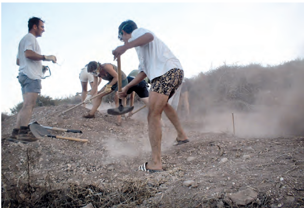
Trabajos para volver a cubrir la superficie excavada durante las excavaciones de 2003. Aplicación de las medidas aportadas por el estudio de Impacto Ambiental.

de carácter prospectivo, que se extienden por todo el enclave insular. El status de área protegida motivó la necesidad de actuar en ese sentido y movió al ICM a presentar a la Fundación Biodiversidad un proyecto de evaluación de impacto denominado Restauración de hábitats naturales sometidos a intervenciones arqueológicas en el Refugio Nacional de islas Chafarinas , dependiente del ministerio de Medio Ambiente. Las futuras actividades arqueológicas debieron seguir convenientemente la regulación que surgió de aquel trabajo a fin de respetar el entorno desde un punto de vista medioambiental a la vez que se desarrollaban los trabajos extractivos. En este sentido finalizaron, dentro del Plan Nacional de Acción de Voluntariado del Organismo Autónomo de Parques Nacionales en el verano de 2004, las obras de construcción de un vivero para la reproducción de especies vegetales autóctonas, un complejo de más de 200 m 2 , en continuo crecimiento y perfeccionamiento, que permitiría la repoblación adecuada de cualquier sector necesitado de las islas, pero construido principalmente como complemento de las actividades arqueológicas.