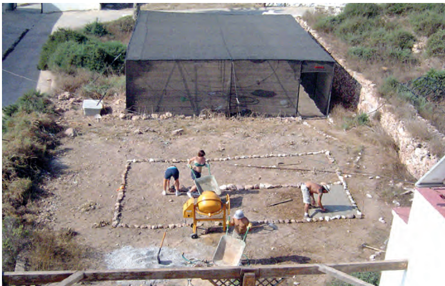
Construcción de un vivero de exterior durante el verano de 2004, junto al umbráculo levantado anterior.