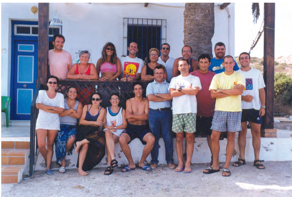
Equipo de excavación en la primera campaña, año 2001.

equipo compuesto por unas 18 personas, muy superior al de cualquier otro proyecto anterior llevado a cabo en las islas.