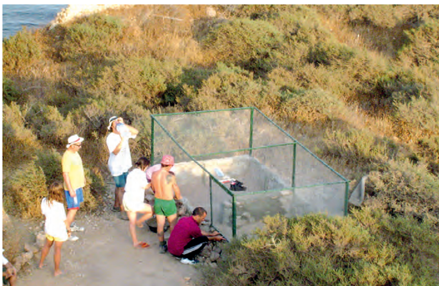
Trabajos durante la construcción de un terrario para el estudio de los eslizones.

Igualmente, con la participación de voluntarios se construyó un terrario para el estudio del eslizón pentadáctilo de mediano tamaño, endémico de la franja costera mediterránea magrebí y las islas Chafarinas, concretamente de la isla del Rey, donde es abundante. Así, estos grupos de jóvenes colaboraron de forma indirecta en algunos de los proyectos científicos llevados a cabo por investigadores de Parques Nacionales en las islas. Otras muchas actividades fueron propuestas y desarrolladas durante los veranos sucesivos, como la fabricación de composteros, levantamientos de muros, mantenimiento y reconstrucción de caminos, actividades que formarían parte de un proyecto común de carácter medioambiental desarrollado por un voluntariado intermitente desplazado a las islas cada verano, siempre dirigidos y coordinados por monitores y personal del ICM.