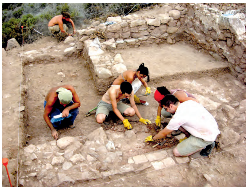
Excavaciones en el yacimiento de La Plataforma en la isla del Congreso con estudiantes de la Universidad de Málaga.

edificio y no se concluyó el proyecto hasta la intervención en el verano de 2007. Los resultados de ambas excavaciones llevaron a relacionar directamente este edificio con los aterrazamientos construidos en la zona norte de la isla, interpretados como posibles bancales destinados al cultivo y probablemente al autoabastecimiento de este contingente. Las prospecciones realizadas en campañas anteriores en este sector aterrazado de la isla, concluyeron que el material arqueológico que aparecía en su entorno era de cronología moderna y que por tanto dichas construcciones no tenían ningún vínculo con el yacimiento prehistórico de Zafrín. Además, la constitución de los muros del edificio y la de las terrazas mostraron idéntica factura, lo que reafirmó la idea de que se llevaron a cabo en un mismo momento, durante la ejecución de un proyecto defensivo para la isla del Congreso.