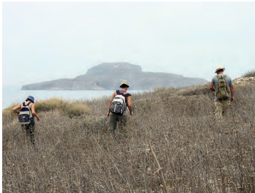
Arqueólogos del Instituto de Cultura Mediterránea durante las prospecciones en la isla del Rey en el año 2005.

de sílex rojo y amarillo en la del Rey. La metodología aplicada en la prospección arqueológica en esta isla se basó en el Sistema de Registro Temático y Espacial de Yacimientos en Superficie (SIRTEYS). Las características metodológicas de este sistema permitían aunar perfectamente los objetivos de investigación arqueológica y de protección patrimonial, tanto cultural como ambiental, que se pretendían alcanzar. Esta metodología estaba basada en la utilización de receptores GPS para cuyo correcto funcionamiento eran necesarias una serie de características geográficas y ambientales que se cumplían perfectamente en esta isla. El equipo de prospección efectuó una exploración exhaustiva de la superficie en busca de materiales arqueológicos o de indicios visibles de estructuras, tarea que se desarrolló durante la campaña arqueológica de 2005.