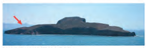
Figura 1. Situación del yacimiento de Zafrín en la isla de Congreso, Islas Chafarinas.

metros. Tiene una forma alargada y alcanza un kilometro en el sentido norte-sur y una anchura variable. El yacimiento de Zafrín se encuentra en el borde sur de la isla, en una zona donde la anchura de la superficie disponible es de aproximadamente 150 m (Bellver y Bravo, 2002b: 12) (Figura 1). Desde el punto de vista geológico las islas conforma de un vulcanismo que se articula en varios episodios eruptivos, a finales del terciario, seguramente pliocénicos. En la actualidad la distancia entre la línea de costa y el archipiélago es de 3,5 km, pero las islas estuvieron unidas a tierra firme, por lo que geomorfológicamente corresponden al extremo norte de lo que fue un antiguo cabo de mayor prolongación que el actual Cabo de Agules. Los materiales que formaban la lengua de unión estaban compuestos fundamentalmente por areniscas y materiales calcáreos cuya naturaleza frágil y blanda determinó que fueran destruidos por la erosión marina, provocando finalmente la separación del continente (Bellver y Bravo, 2002b: 11). A esta separación contribuyó también el ascenso del nivel del mar en la tregua del Pleistoceno, cuyo máximo tuvo lugar hace el 6500 a.C., estabilizándose hacia el 5500