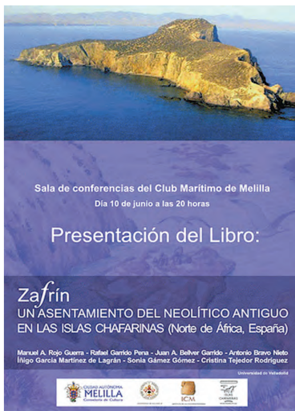
Presentación del libro Zafrín, un asentamiento del Neolítico Antiguo en las islas Chafarinas en el Club Marítimo.

Y finalmente, la obra definitiva que recopila todas las campañas es el libro colectivo editado por la Universidad de Valladolid en el año 2010, Zafrín: un asentamiento del neolítico antiguo en las islas Chafarinas (Norte de África, España) , trabajo para el que se dedicó un tomo de la serie Studia Archaeologica del Departamento de Prehistoria de la Universidad de Valladolid.