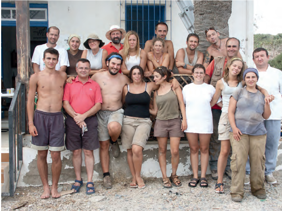
Equipo de excavación en la campaña de 2004.