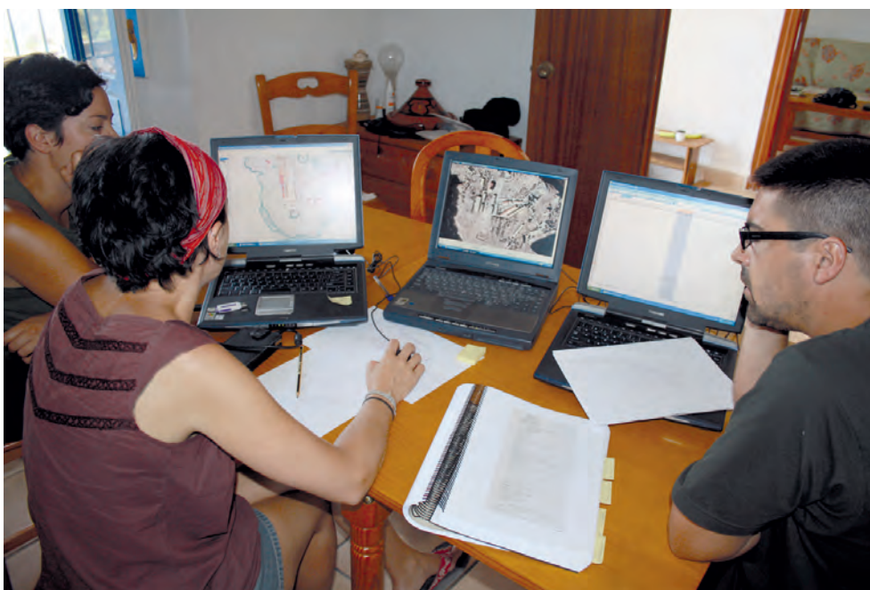
Equipo de trabajo en las islas durante la realización del proyecto “Catalogación, clasificación y digitalización de expedientes de obras públicas y privadas sites en los archivos nacionales”.

la última etapa del proyecto fue aportar todos los datos e información posibles sobre la ubicación de cada una de las construcciones, tanto si existían en la actualidad como si no. Se llevó a cabo un trabajo topográfico que recogería todos los restos constructivos dispersos en el terreno perteneciente a los edificios desaparecidos. Junto con las construcciones existentes y en uso, estos edificios olvidados formarían parte de un plano integral, asociado a sus tablas de atributos y datos espaciales, mostrando la fisonomía que un día tuvieron las islas. Estos datos acerca de la evolución aparente del archipiélago servirían para realizar un documento completo con información pormenorizada de todos los edificios y usos de los mismos a lo largo de la historia de las islas que ayudarían a entender su evolución desde los primeros edificios construidos a mediados del siglo XIX hasta la actualidad. La digitalización de la evolución de las infraestructuras defensivas, de los edificios militares y particulares, los puertos o aljibes mostró el esplendor urbano que tuvo la isla Isabel II, la única habitada en permanencia y la que ha sufrido la mayor presión humana desde su ocupación.