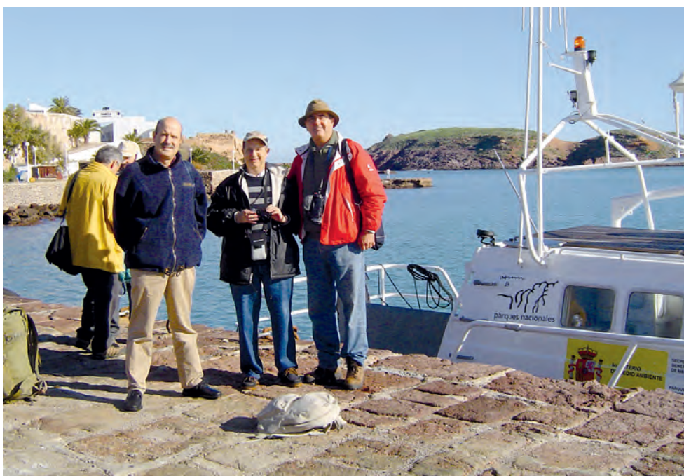
Llegada al puerto de Chafarinas del grupo de geólogos que participaron en el proyecto del yacimiento de Zafrín.

Presunción que surge al pensar en la gran dificultad que sería habitar en las islas para aquellos pobladores neolíticos, no solo por el espacio reducido en el que se encontraban, sino porque sería necesario transportar el agua potable y las piezas de caza cobradas por medios marítimos hasta las mismas. Los resultados fueron de gran interés para conocer el desarrollo del yacimiento y las circunstancias que llevaron a su abandono.