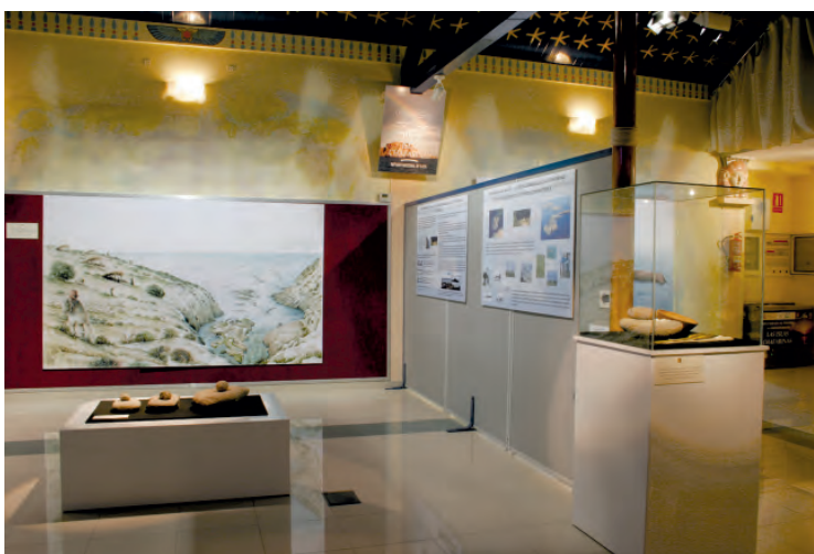
Montaje de la exposición "Una mirada al pasado: Prehistoria de las islas Chafarinas", en la Fundación Gaselec en el año 2006.