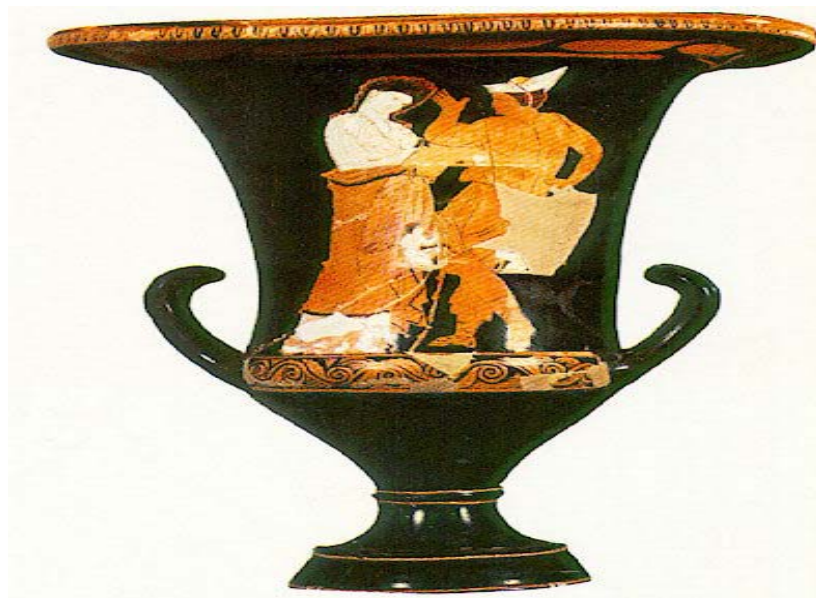
2ª Imagen: La cratera de «Erotostasia» 330 a.C. Museo Nacional Arqueológico de Atenas. Hellas.