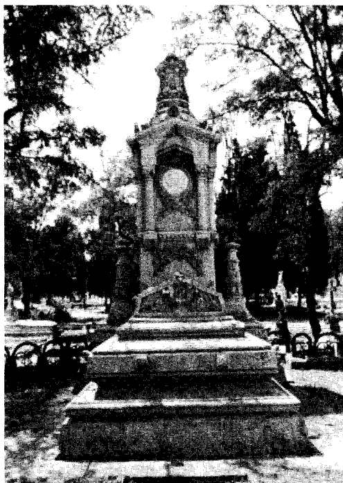
Monumento a los hombres ilustres, trasladado del cementerio General del Norte al cementerio de Epidemias

no había sabido defender los intereses de la Sagrada Familia, perjudicando con ello a los que dependían de su intercesión. Ya que los símbolos desaparecían de los espacios públicos antes sacralizados, habría que buscar otros espacios, arrancándoselos a terrenos no urbanizados (fuentes, prados, matorrales, etc.), desplazando los territorios sagrados de los centros urbanos a las periferias para poder construir allí nuevos santuarios. Esta pretensión contaba con la oposición de gran parte de la curia, que intentaba fortalecer los lugares de culto consolidados y canalizar esas manifestaciones populares hacia movimientos de tinte político.