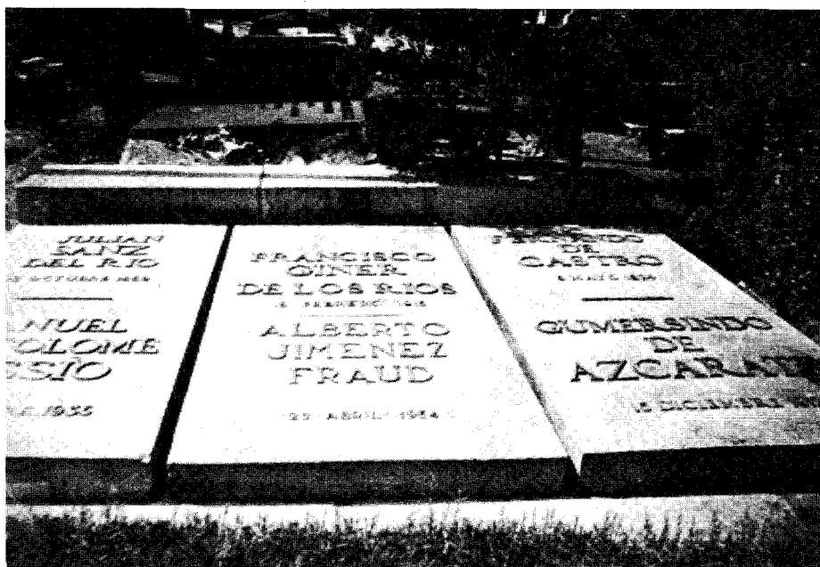
Cementerio civil de Madrid. Tumbas de Julián Sanz del Río, Manuel Bartolomé Cossío, Francisco Giner de los Ríos, Alberto Jiménez Fraud, Fernando de Castro y Gumersindo de Azcárate