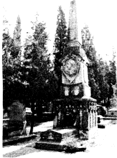
Monumento a los librepensadores

las personas enterradas en ellos de llevarse sus despojos a los nuevos cementerios laicos en una especie de curiosa reagrupación familiar.