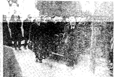
ENTRERO DE D. FRANCISCO GIVER. Conquistada del Zavaie al asediado situado entre las espaldas de San del Zavaie y Fernando de Castro.

Unos buques en Tenerife. La imagen muestra una escena marítima con varios buques en el agua. El texto describe la actividad portuaria y el tráfico marítimo en la zona.