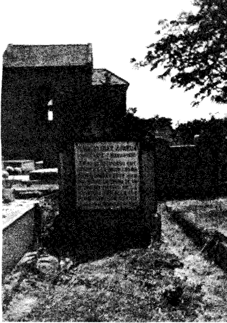
Mausoleo de los masones