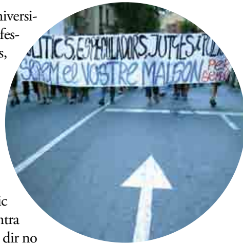
La «revista caminada» ha esdevingut un símbol i un referent per al moviment okupa per la seva repercussió social i mediàtica. JORDI PLAY

El suport d'amplis sectors socials de la ciutat al Laboratori, que inclourà alguns dels mitjans de comunicació (19) més forts, no es produirà tant a partir d'un èmfasi en el conflicte plantejat per l'okupació, respecte a la qüestió de l'habitatge dins del model de la ciutat dominant, sinó que la legitimitat reivindicada es sustentà, sobretot, en aquesta vessant del CSOA com a centre d'activitats socials i culturals, completament allunyat de qualsevol tipus de violència i, d'aquesta manera, de la figura que tradicionalment representa l'okupa en l'imaginari de la ciutat. La utilitat col·lectiva del centre social okupat, com a nucli de propostes socials i culturals que no tenen cabuda en un altre lloc i que caracteritzen un sector ampli de la joventut urbana, serà el fil conductor que