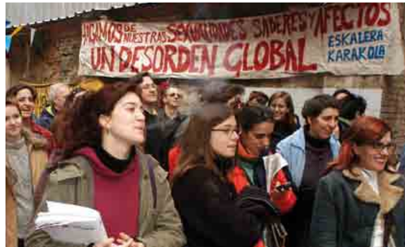
Una de les característiques dels centres okupats és l'autogestió i el caràcter assembleari.

En segon lloc, un altre eix de conflicte està relacionat amb com les pràctiques okupes