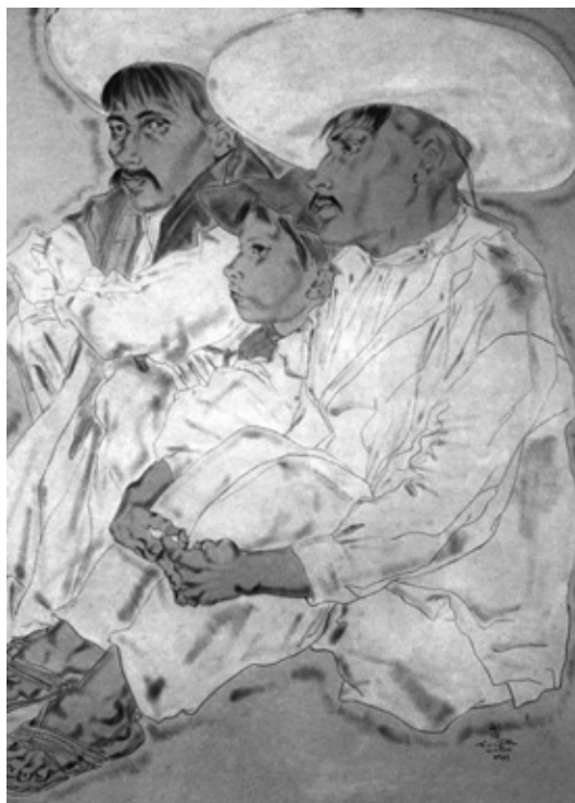
3. Familia mexicana , 1933. Colección Louis Eychenne, México D.F.