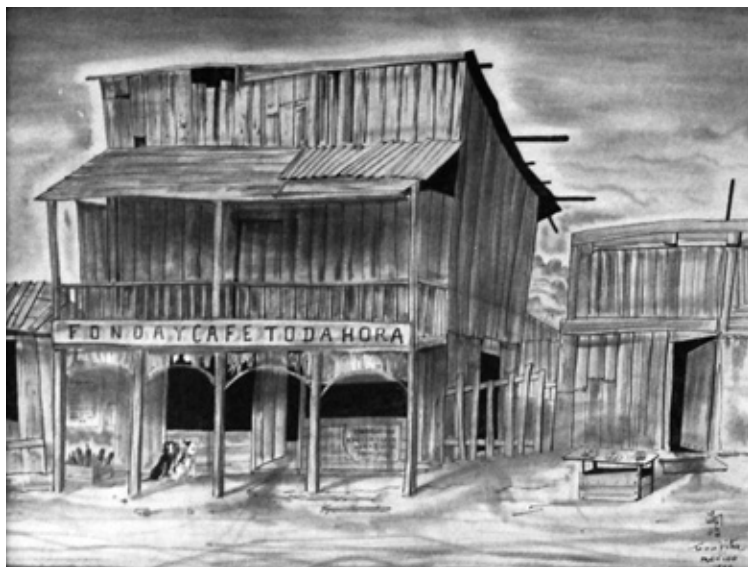
4. Fonda y café Toda Hora, 1933.