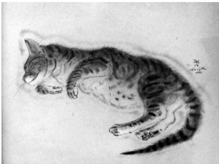
5. Chat endormi , 1932. Colección Louis Eychenne, México D.F.

tos y que reiteró en distintas versiones, en unos casos en distintas posturas, en otros en copias miméticas destinadas a la venta 12 .