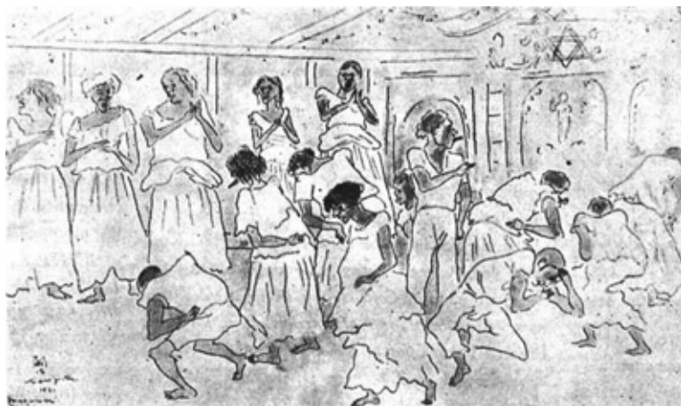
1. La Macumba . Dibujo reproducido en la revista Monterrey. Correo Literario de Alfonso Reyes . Río de Janeiro, marzo de 1932, n.º 8, p. 1

la duración de su estancia allí no está bien delimitada, pues además de recorrer gran parte del país, durante su permanencia se trasladó a Nuevo México, Arizona y California, visitando Los Ángeles y San Francisco. A finales de 1933 regresará por fin a Japón.