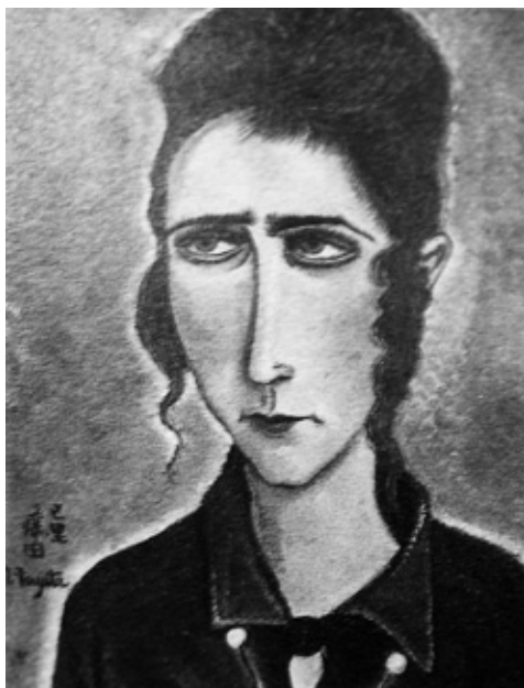
9. Joven de T. Foujita, c. 1916-1919.