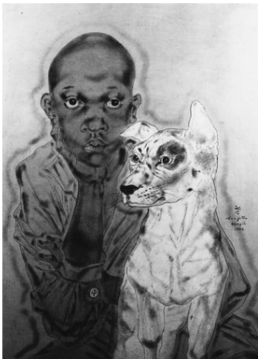
2. Joven mulato con perro , 1932. Colección Louis Eychenne, México D.F.

en la capital y solitario en sus campos y pueblos, como Foujita reflejó en otra acuarela de 1933, Fonda y café Toda Hora [4], de una quietud, una serenidad y una soledad parangonable a los ambientes y escenarios de la pintura metafísica, pero que en realidad continúan el gusto que tuvo en París por captar rincones y esquinas del paisaje urbano, los rincones enternecedores de los arrabales, de la banlieue , impregnados de una apariencia reveladora, misteriosa y mágica, muy alejada de lo cotidiano. No obstante, es evidente que en América su estilo ha evolucionado, ha ganado en contrastes y en riqueza cromática, sustituyendo el blanco nacarado de sus anteriores figuras, que prescinden del color, por tonalidades ocre y rojizas, tonos siempre contenidos, pues nunca fue un pintor colorista en el sentido occidental.