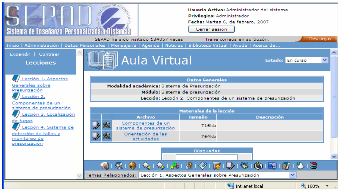
Fig.1. Lecciones del curso “Sistema de presurización”

Para poder acceder a los cursos el estudiante debe poseer un computador personal que en lo posible esté equipado con kit multimedia. Atendiendo a los servicios que brinda la plataforma SEPAD no se requiere de una conexión a la Intranet, si el estudiante posee una cuenta de correo electrónico.