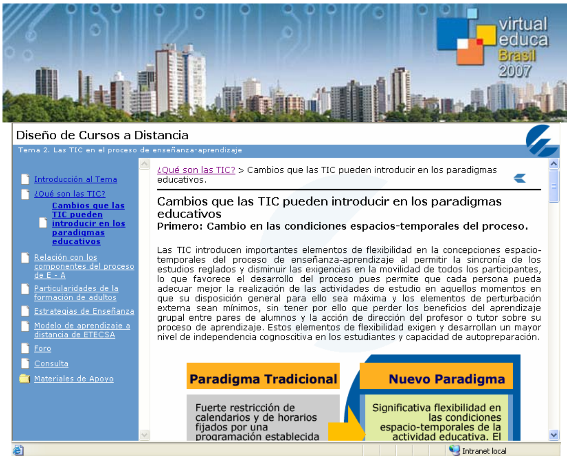
Fig. 2 Menús de navegación e imagen corporativa de las lecciones del curso “Diseño de cursos a distancia”.

Se utiliza básicamente el formato HTML para la producción del material didáctico. La presentación de la información también se hace empleando, cuando es conveniente, animaciones (de elaboración propia o tomadas de otras fuentes) y mapas sensitivos que hacen del proceso de aprendizaje una experiencia interesante, llena de alternativas y efectiva.